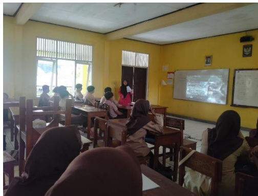
Gambar 5 Proses pembelajaran hari ke-2