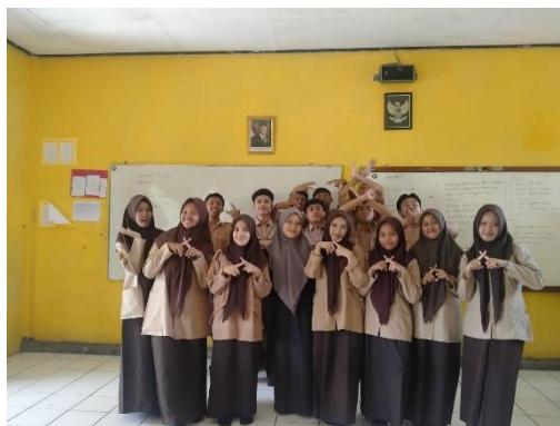
Gambar 6 Siswa kelas X3 MAN 3 Cijantung Ciamis