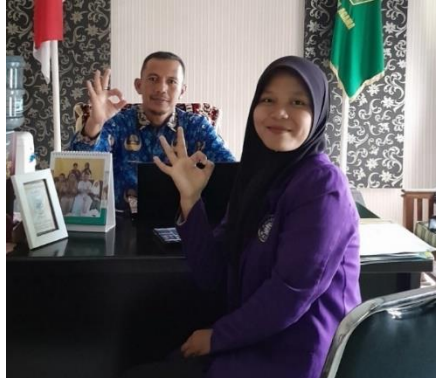
Gambar 7 Wawancara Bersama Kepala Sekolah MAN 3 Cijantung Ciamis