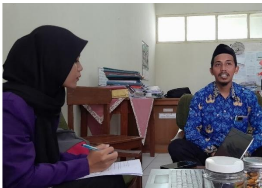
Gambar 8 Wawancara Bersama Wakabid Kurikulum MAN 3 Cijantung Ciamis