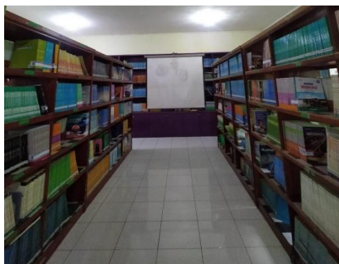
Gambar 12 Perpustakaan