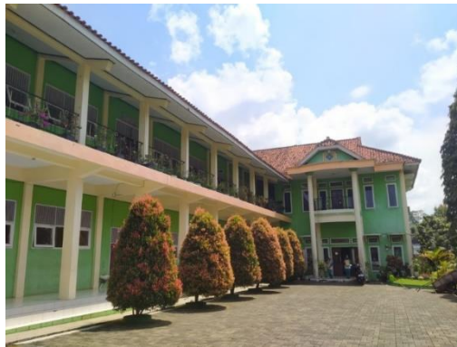
Gambar 11 Ruang TU dan Kelas