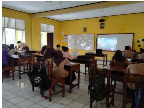
Gambar 4 Proses pembelajaran hari ke-1