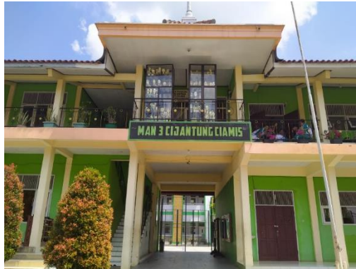
Gambar 1 Tampak depan Sekolah