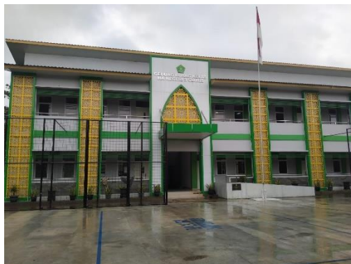
Gambar 2 Gedung kelas 12 dan kantor guru wanita