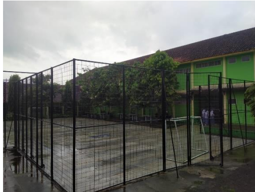
Gambar 13 Lapangan Serbaguna