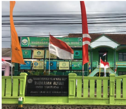
Dokuemntasi 7 Madrasah Aliyah Nurul Huda