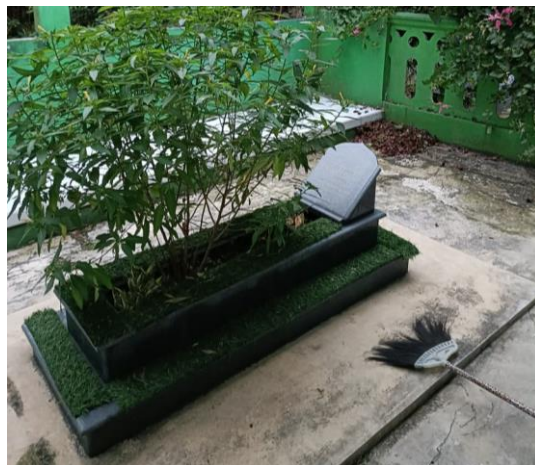
Dokuemntasi 8 Makam KH. Idi Kholidi