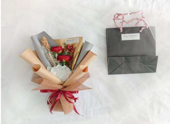
Lampiran 1 keandalan (pengemasan Paperbag)