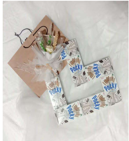
Lampiran 2 keandalan (pengemasan Paperbag)