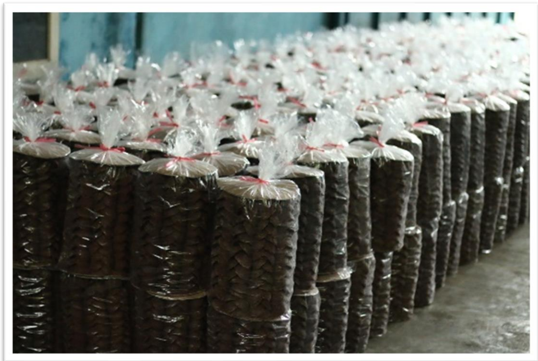
Gambar 21. Produk gula merah UMKM di Kecamatan Lakbok Kabupaten Ciamis.