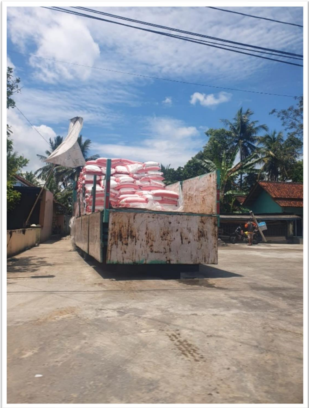
Gambar18. Kegiatan distribusi GKR di CV. SUMBER SARI UTAMA Kecamatan Lakbok Kabupaten Ciamis.