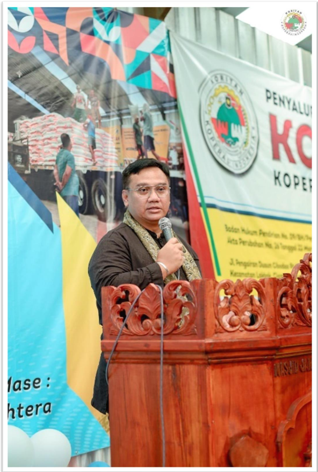
Gambar 12. Bpk. Yeka Hendra Fatika (Pimpinan OMBUDSMAN RI).