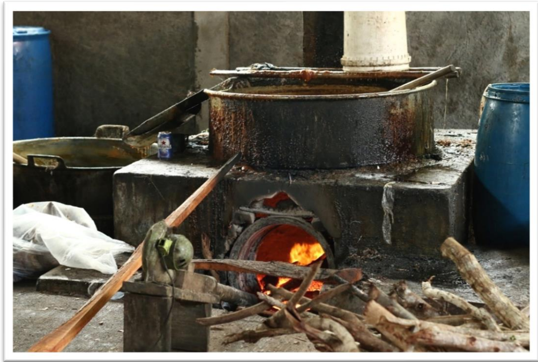
Gambar 20. Tungku masak gula merah UMKM di Kecamatan Lakbok Kabupaten Ciamis.