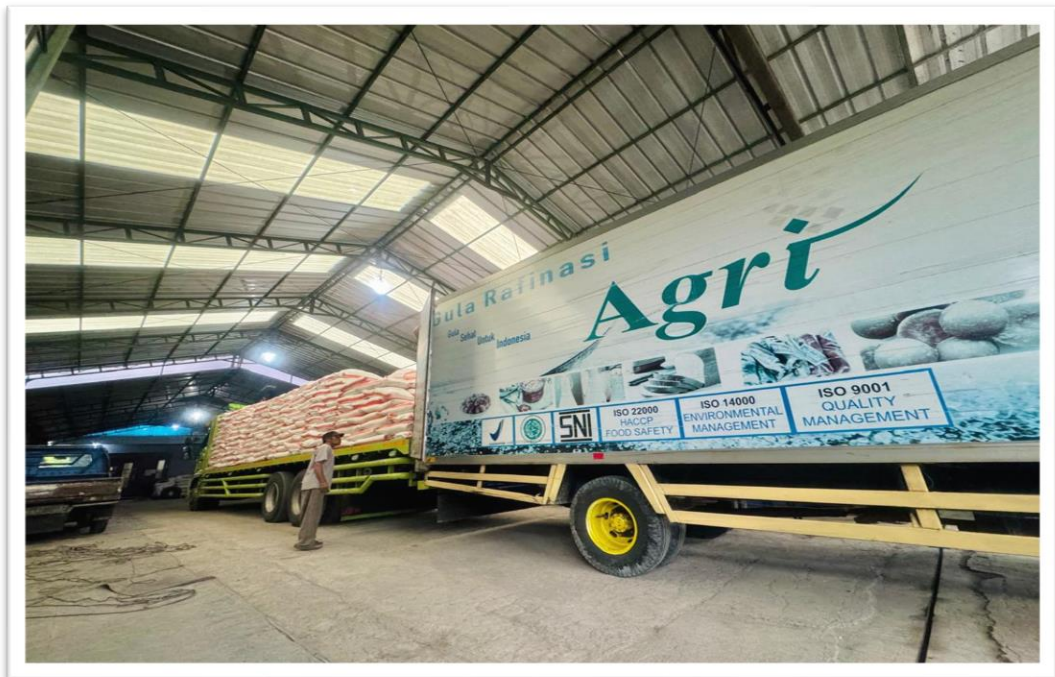
Gambar 17. Kegiatan Distribusi GKR di gudang Koperasi Ritel Tambun Kecamatan Lakbok Kabupaten Ciamis..