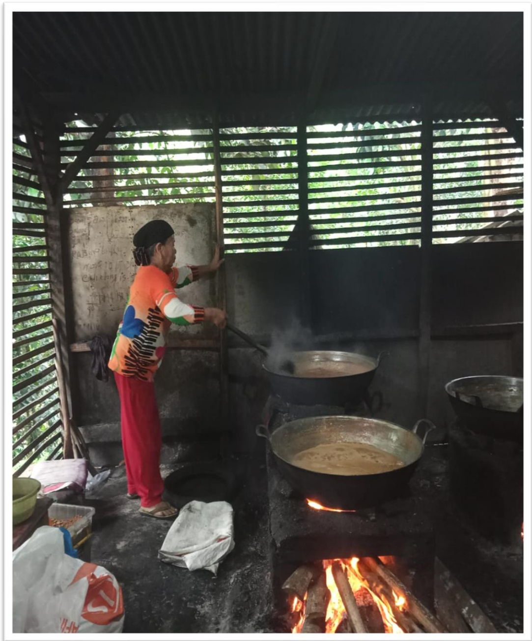
Gambar 23. Proses produksi gula merah UMKM pengguna bahan baku GKR di Kecamatan Lakbok Kabupaten Ciamis.