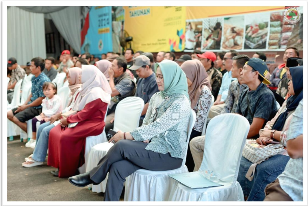
Gambar 16. Wawancara penulis dengan UMKM dalam acara RAT KORITAN ke-XVIII tahun buku 2024. Lakbok, 18 Januari 2025.