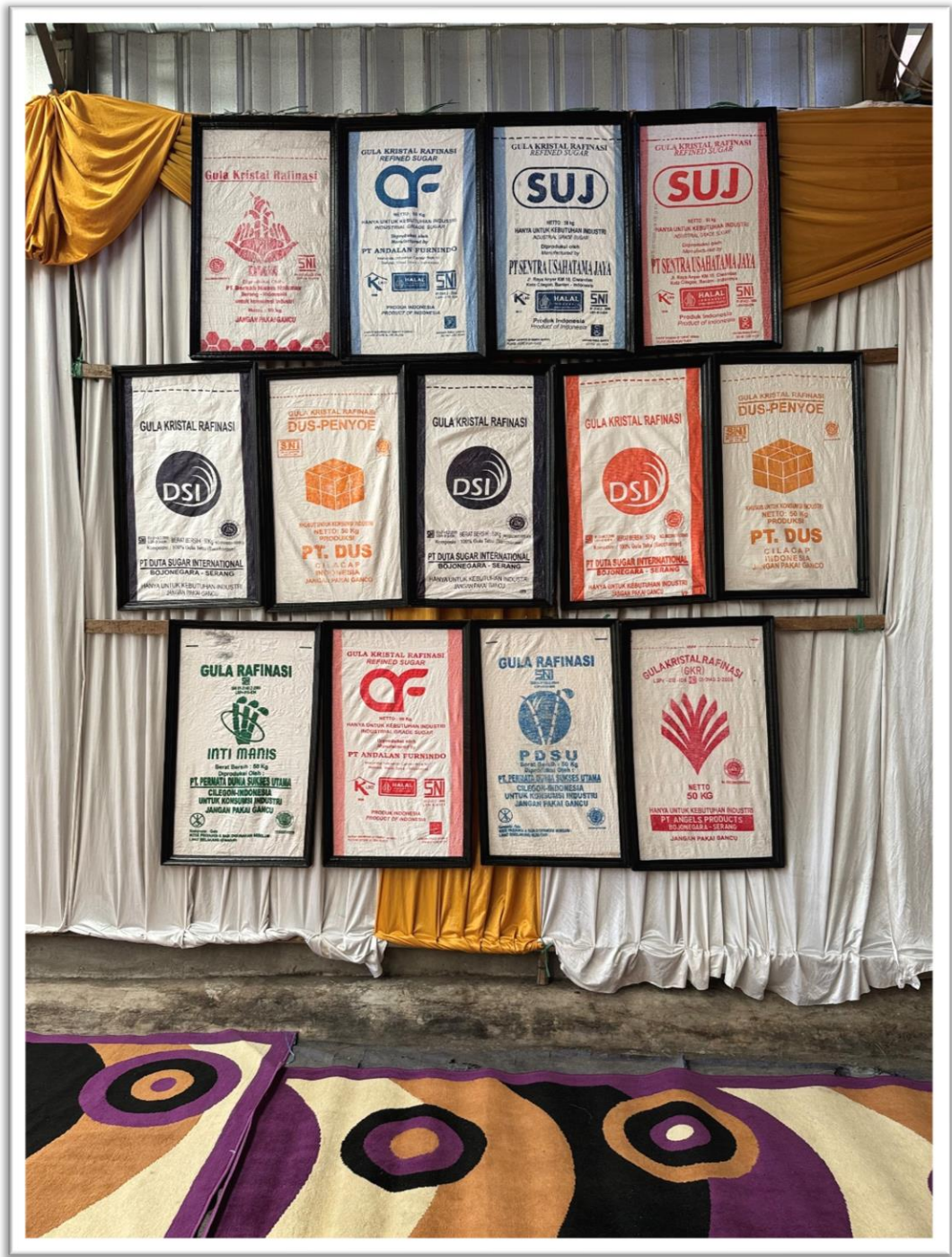
Gambar 24. Kemasan Gula Kristal Rafinasi dari Produsen GKR di Indonesia