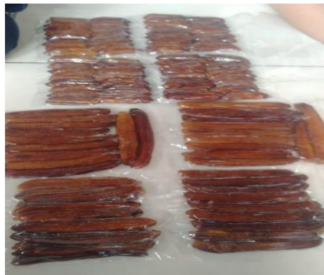
Proses pengemasan menggunakan kemasan vakum