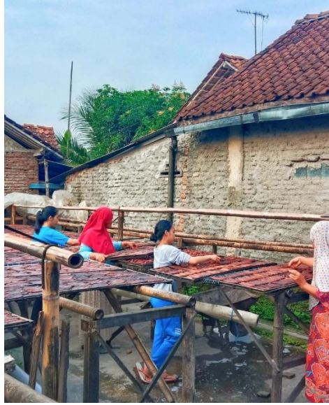
Proses penjemuran sale pisang basah