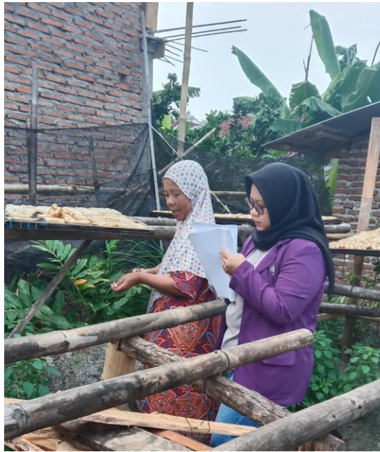
Wawancara kepada pekerja agroindustri sale pisang basah Mitra Sale