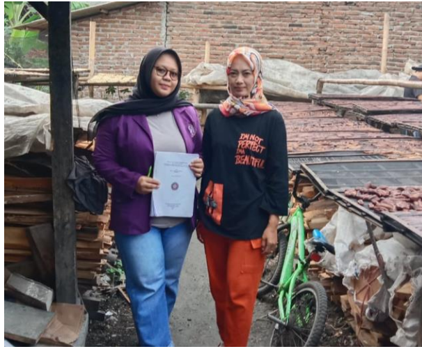
Wawancara kepada informan utama/pemilik agroindustri sale pisang basah Mitra Sale