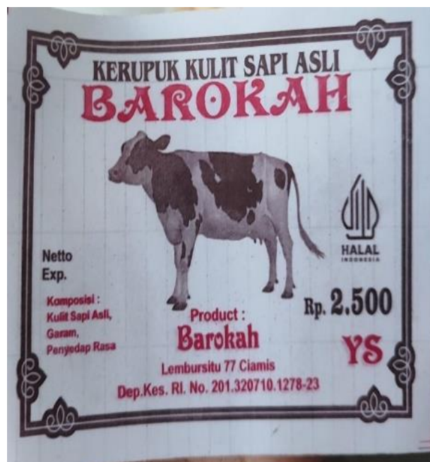
Dokumentasi 4. Foto logo merek kerupuk kulit barokah