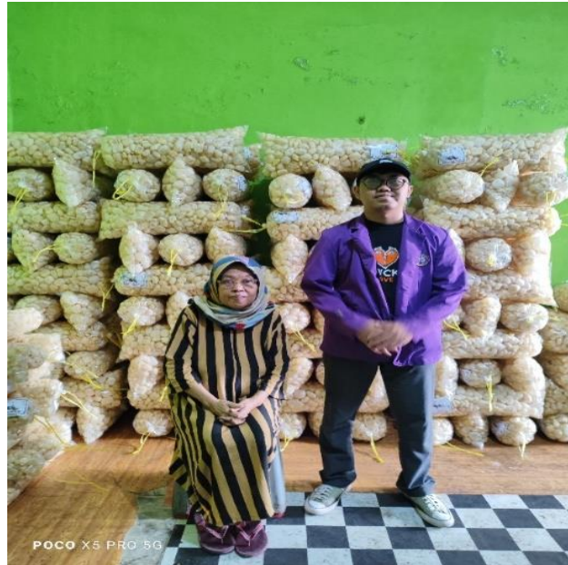
Dokumentasi 1. Foto bersama pemilik kerupuk kulit barokah