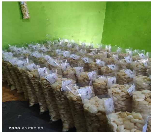
Dokumentasi 2. Foto produksi kerupuk kulit barokah