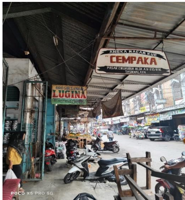
Dokumentasi 3. Foto toko “campaka” yang berada di Pasar Cikurubuk