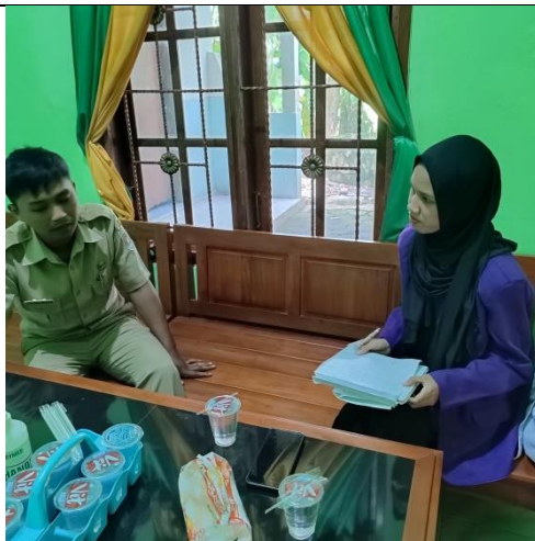
Perangkat Desa Bumireja