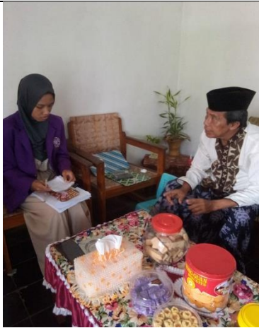
Ketua BPD Desa Bumireja