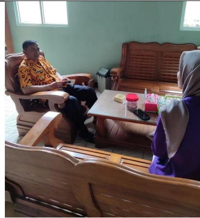
Kepala Desa Bumireja