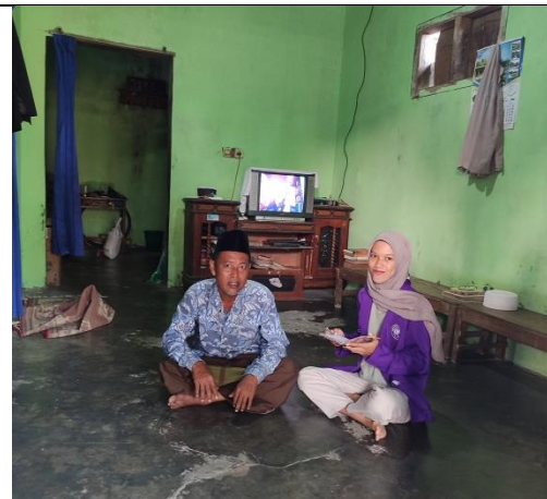
Tokoh Masyarakat Desa Bumireja