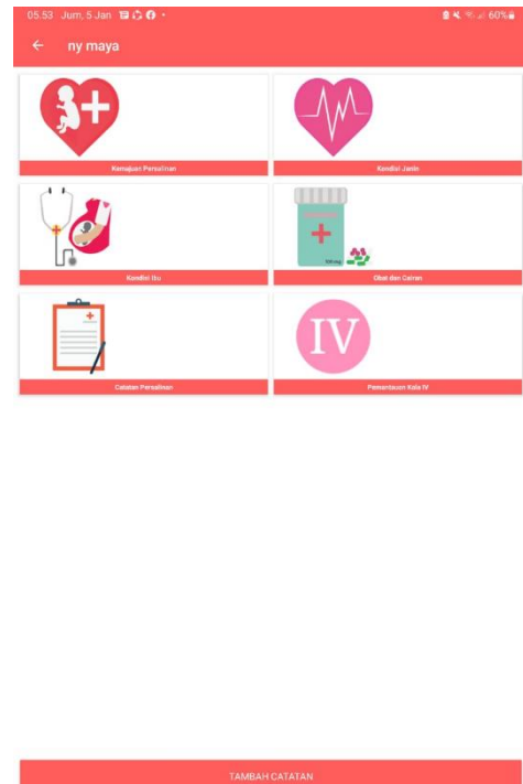
Gambar 1. Menu Partograf Digital