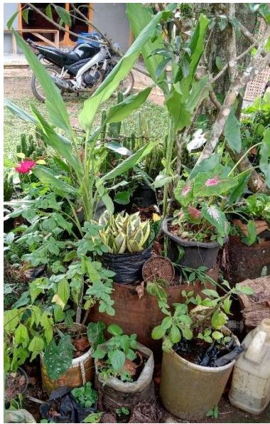
Gambar 43. TOGA di Halaman Rumah Warga.