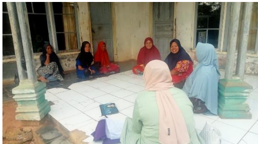
Gambar 37. Pengambilan Data Penelitian.