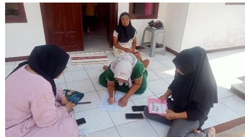
Gambar 38. Pengambilan Data Penelitian. (Sumber: Ucu Febrianti, 2024)