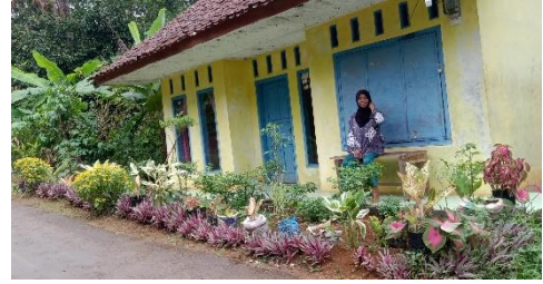
Gambar 42. TOGA di Halaman Rumah Warga.