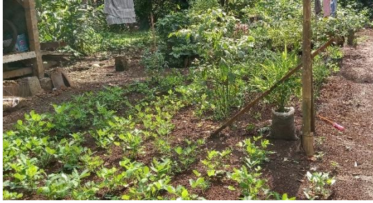
Gambar 41. TOGA di Halaman Rumah Warga.