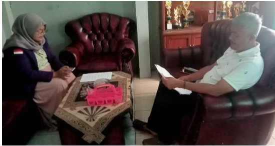
Gambar 35. Bertemu Kepala Desa Tanjungjaya.