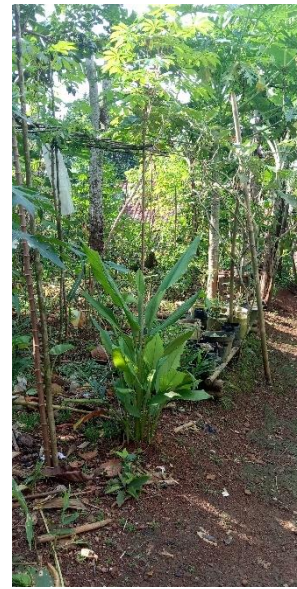
Gambar 44. TOGA di Halaman Rumah Warga.