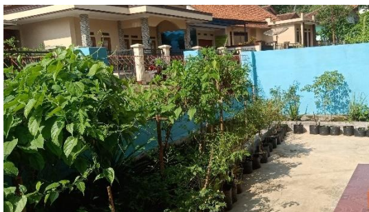
Gambar 39. TOGA di Halaman Rumah Warga.