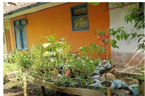
Gambar 40. TOGA di Halaman Rumah Warga.