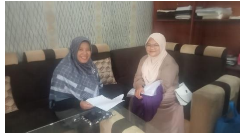
Gambar 36. Bertemu Kepala Dusun.