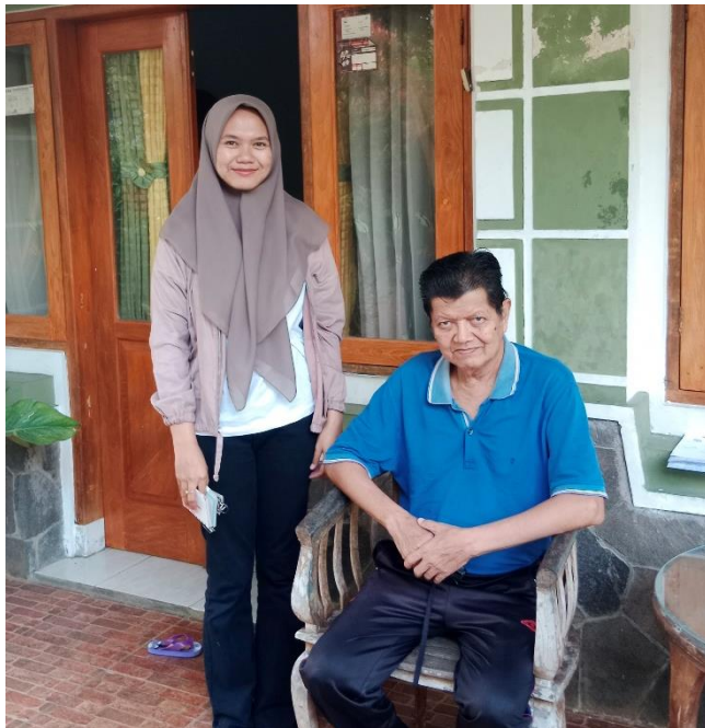
Gambar 3.5 Wawancara dengan pegawai Desa Cisaga