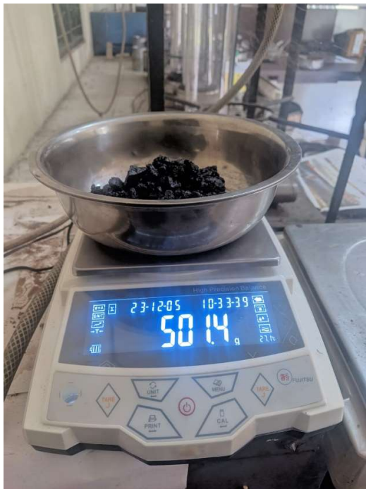
Gambar 1. Menimbang Sebelum di Ekstraksi