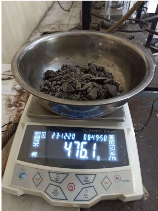
Gambar 1. Penimbangan hasil ekstraksi