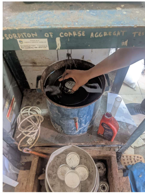
Gambar 2. Proses Penimbangan di air