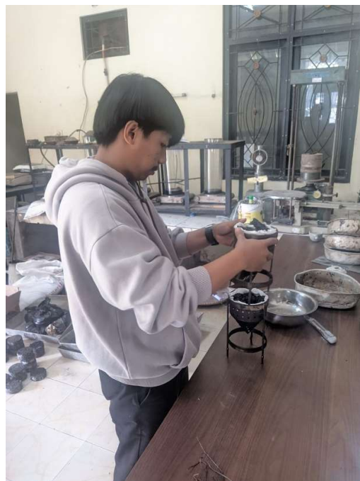
Gambar 2. Proses Peulelehan sempel