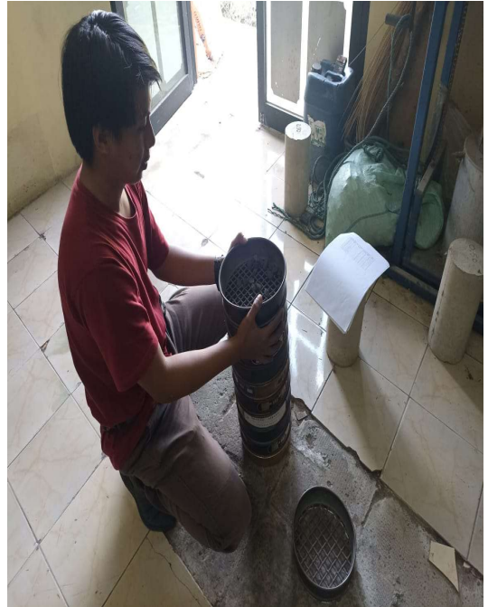
Gambar 2. Proses penyaringan hasil ekstraksi