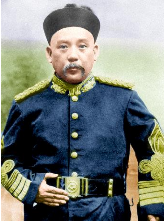
Gambar 5. Panglima Yuan shikai https://id.wikipedia.org/wiki/Yuan_Shikai

Panglima perang bukan sekadar jenderal pemberontak, melainkan penguasa regional yang memiliki tentara tetap, bank sendiri, mata uang lokal, dan sistem pajak pribadi (termasuk pajak candu yang sangat menguntungkan). Hsi-sheng Ch'i (1976) mengidentifikasi tiga kelompok utama: (1). Zhili Clique (dipimpin Wu Peifu dan Feng Guozhang), (2). Anhui Clique (Duan Qirui), (3). Fengtian Clique di Manchuria (Zhang Zuolin) Selain itu ada puluhan panglima kecil seperti Yan Xishan di Shanxi, Feng Yuxiang ("Jenderal Kristen"), dan keluarga Chen Jiongming di Guangdong. Periode 1916–1928 ditandai perang antar-klik yang terus-menerus: Perang Zhili