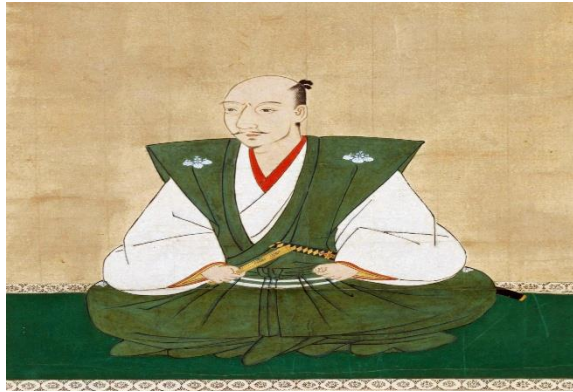
Gambar 8. Oda Nobunaga