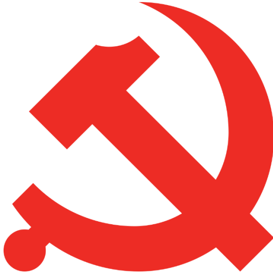
Gambar 4. Logo Partai Komunis Cina

mailto: https://id.wikipedia.org/wiki/Partai_Komunis_Tiongkok#/media/Berkas:Danghui.svg