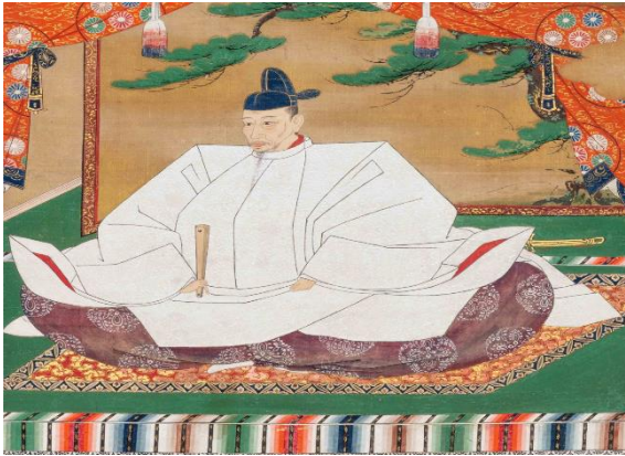
Gambar 9. Toyotomi Hideyoshi