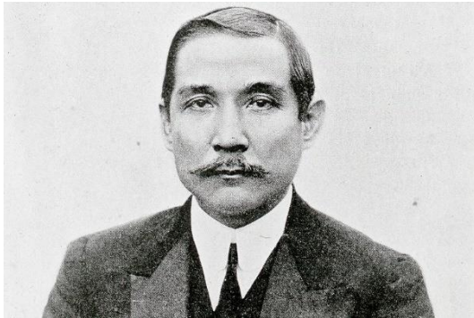
Gambar 2. Sun Yat Sen

Sun Yat Sen muncul sebagai tokoh pembaharu yang pemikirannya dipengaruhi oleh pengalaman lintas budaya dan pendidikan Barat di Hong Kong dan Hawaii, tetapi tetap berakar pada nilai-nilai Konfusianisme dan etika Tiongkok tradisional. Karena itu, ia berusaha memadukan dua dunia (rasionalitas Barat dan moralitas Timur). Berbeda dengan elite Qing yang cenderung mempertahankan tradisi feodal, Sun Yat Sen mengembangkan pandangan kritis terhadap sistem monarki absolut yang dianggap sebagai sumber utama kemunduran Tiongkok. Menurut Suryani (2016), Sun Yat Sen melihat bahwa pembentukan negara modern mensyaratkan merupakan perubahan mendasar dalam struktur kekuasaan dan hubungan antara negara dan rakyat.