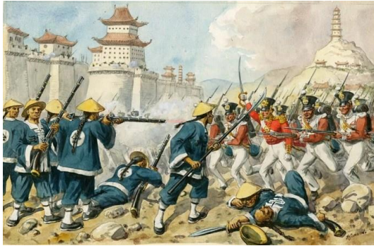
Gambar 1. Ilustrasi Pecang Opium

harus menandatangani Perjanjian Nanking yang membuka pelabuhan-pelabuhan bagi Inggris dan memaksa kaisar membayar ganti rugi besar. Perang Opium kedua kembali meletus pada 1856 dan semakin melemahkan kedaulatan Tiongkok. Kekaisaran dipaksa menerima lebih banyak konsesi, termasuk legalisasi opium dan kehadiran diplomatik Barat.