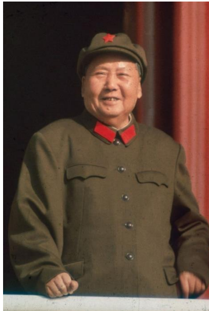
Gambar 7. Mao Zedong

Mao Zedong lahir di Shaosan, Hunan, Cina pada tanggal 26 Desember 1893. Ayahnya bernama Yi-chang dan ibunya seorang berasal dari keluarga Wen. Ia menempuh pendidikan Sekolah Dasar di Shaosan pada tahun 1901- 1906. Sekolah Dasar di Thongsan pada tahun 1906.