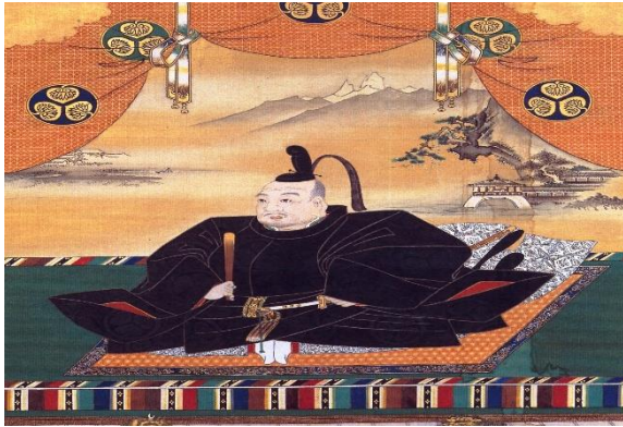
Gambar 10. Tokugawa Ieyasu