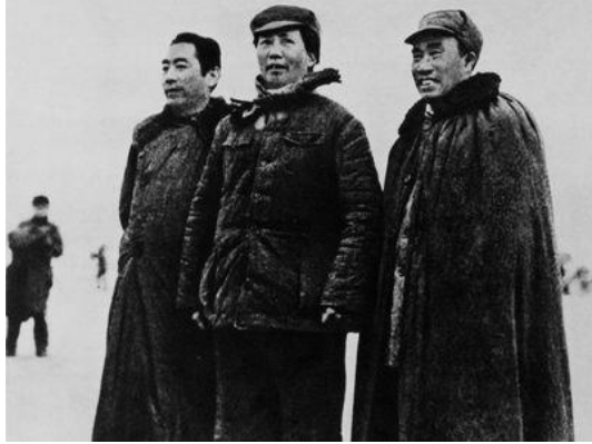
Gambar 6. Mao Zedong (tengah) memimpin kaum komunis Tiongkok dalam Long March bersama Zhou Enlai (kiri) dan Zhu De (kanan), Jiangxi, Tiongkok, 1935 https://www.britannica.com/event/Long-March

Pada Desember 1936, Chiang Kai-shek diculik di Xi'an oleh Zhang Xueliang dan Yang Hucheng (Insiden Xi'an). Zhou Enlai yang datang bernegosiasi berhasil memaksa Chiang menerima Front Persatuan Kedua melawan Jepang tanpa syarat tertulis. Perang meletus Juli 1937 (Insiden Jembatan Marco Polo). Dalam 18 bulan pertama, Nasionalis kehilangan Shanghai, Nanjing (Pembantaian Nanjing, Desember 1937), Wuhan, dan Canton. Chiang memindahkan ibu kota ke Chongqing. Sementara itu, PKT mengembangkan basis gerilya di belakang garis Jepang (Shaanxi-Gansu-Ningxia, Jin-Cha-Ji, dll.). Pada 1945, Tentara Merah PKT sudah berkembang dari 40.000 menjadi hampir 1 juta tentara reguler ditambah 2 juta milisi (Westad, 2003).