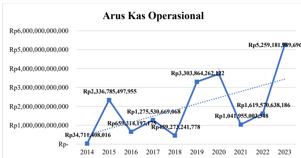
Gambar 4. 2 Arus Kas Operasional PT Mayora Indah Tbk. Tahun 2014-2023 Sumber : Data Laporan Keuangan PT Mayora Indah Tbk

Interpretasi: Peningkatan arus kas operasional mencapai 224,73%, menjadi salah satu capaian tertinggi selama periode penelitian. Artinya peningkatan besar ini menunjukkan bahwa perusahaan mampu memperkuat kinerja operasionalnya secara signifikan, mencerminkan efisiensi dan pertumbuhan aktivitas usaha yang positif.