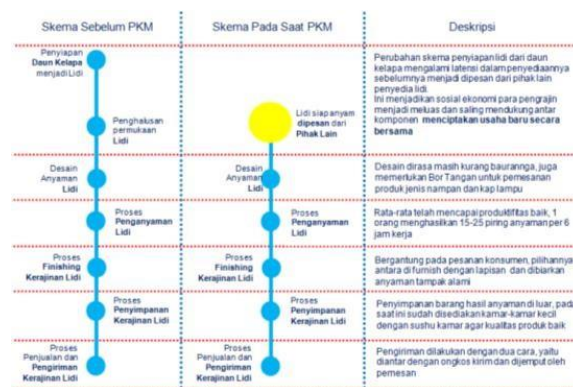
Gambar 3 Perubahan Skema Produksi Anyaman Pada Mitra 1 Dan Mitra 2

Adapun peralatan yang di stimulasikan pada pengusul karena terjadi perubahan skema dalam mendapatkan bahan baku maka hal yang paling diperlukan adalah pada proses desain dan produksi anyaman. Mitra 1 maupun Mitra 2 pada saat ini menerima order untuk pembuatan nampan (mitra 1) dan kap lampu (mitra 2) dari masing-masing langgananya. Dengan demikian menurut pandangan mereka peralatan yang semula diusulkan kepada pelaksana PKM mesin ampelas dan pemotong lidi menjadi Bor tangan yang mereka butuhkan. Maka dalam hal ini pelaksana sebenarnya tidak bisa menyediakan peralatan tetapi untuk menstimulasi kegiatan mereka dibantu 2 unit bor tangan untuk menunjang produksi dan peningkatan usahanya.