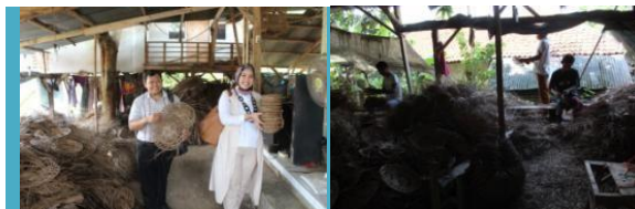
Gambar 1. Para instruktur manajemen produksi

Berdasarkan hasil dari pre-test yang dilakukan pelaksana PKM menyimpulkan bahwa pengetahuan produksi dipahami oleh para ketua mitra dan peserta yang memiliki kemampuan untuk berwirausaha. Kognitif peserta yang berwitausaha sangat baik dalam merespon bidang produksi. Sisanya belum mendapatkan stimulasi dalam memahami produksi, proses produksi dan waktu produksi. Kegiatan pelatihan ini juga dapat memperkuat spirit dan meningkatkan kepercayaan diri dalam memahami kegiatan wirausaha (lihat Gambar 1).