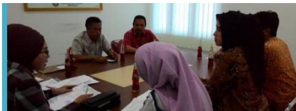
Gambar 5. Diskusi Persiapan Pelatihan Manajemen Usaha

untuk bisa memiliki bekal manajemen usaha berupa pembukuan sederhana arus pengeluaran dan pemasukan apabila suatu saat mereka dapat merintis kegiatan usaha yang dikembangkan secara intensif setelah mendapatkan sosialisasi dan pelatihan. Prosedur dan tata cara pengurusan ijin juga dilatihkan kepada ibu-ibu mitra untuk memberikan bekal tentang pengurusan ijin usaha baik yang sifatnya individu maupun kelompok dari baik kelompok mitra 1 dan mitra 2 yang merupakan mitra PKM. Pengurusan ijin penting karena ke depan nantinya mitra dapat menggunakan SIUP yang dimiliki untuk berbagai kegunaan seperti agunan simpan pinjam di LPD maupun BRI terdekat di tingkat Kecamatan Banjarsari Kabupaten Ciamis.