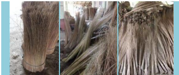
Gambar 2. Pemesanan lidi siap anyam

Perubahan skema penyediaan lidi dari raw material daun kelapa menjadi lidi siap anyam menjadi menggunakan pihak lain sebenarnya adalah untuk memudahkan mitra mendapatkan bahan baku tanpa menggunakan tenaga kerja yang ada (Gambar 5.2). Sehingga tenaga kerja yang menangani penyiapan bahan baku menjadi dialihkan di bagian penganyam. Dilihat dari efisiensi dari penyediaan lidi dari pihak luar sangat baik sehingga mitra bisa lebih fokus di bidang produksi anyaman. Tetapi disisi lain kegiatan menjadi tidak lagi hulu-hilir.