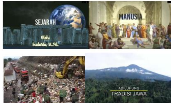
Gambar 1. Cuplikan potongan media pembelajaran

Tema Sejarah Global, melalui PBL peserta didik menjawab pertanyaan seperti "Bagaimana kita mendefinisikan globalisasi?" dan "Apa dampaknya terhadap berbagai budaya?". Peserta didik bekerja dalam kelompok untuk meneliti studi kasus tertentu dari berbagai wilayah dan periode waktu. Hasil pembelajaran ini menghasilkan peningkatan keterampilan kolaboratif dan pemikiran kritis saat mereka terlibat dengan berbagai perspektif. Umpan balik menunjukkan bahwa peserta didik merasa lebih terhubung dengan isu-isu global dan memahami kompleksitas narasi sejarah. Melalui tema Civic Engagement through History , yang memadukan PBL ke dalam kurikulum sejarah dengan meminta mereka mengerjakan proyek yang membahas isu sejarah lokal yang memengaruhi komunitas. Mereka menyelidiki peristiwa sejarah yang relevan dengan perkembangan atau permasalahan yang dihadapi desa/kota dan mengusulkan solusi atau inisiatif pendidikan berdasarkan temuan. Luaran program ini, peserta didik melaporkan peningkatan kesadaran dan tanggung jawab warga negara, serta peningkatan keterampilan penelitian dan presentasi. Program ini berhasil menjembatani kesenjangan antara sejarah akademis dan keterlibatan masyarakat.