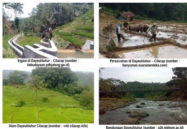
Gambar 2. Cuplikan media pembelajaran "belajar melalui tradisi"

Tema Sejarah Global, melalui PBL peserta didik menjawab pertanyaan seperti "Bagaimana kita mendefinisikan globalisasi?" dan "Apa dampaknya terhadap berbagai budaya?". Peserta didik bekerja dalam kelompok untuk meneliti studi kasus tertentu dari berbagai wilayah dan periode waktu. Hasil pembelajaran ini menghasilkan peningkatan keterampilan kolaboratif dan pemikiran kritis saat mereka terlibat dengan berbagai perspektif. Umpan balik menunjukkan bahwa peserta didik merasa lebih terhubung dengan isu-isu global dan memahami kompleksitas narasi sejarah. Melalui tema Civic Engagement through History , yang memadukan PBL ke dalam kurikulum sejarah dengan meminta mereka mengerjakan proyek yang membahas isu sejarah lokal yang memengaruhi komunitas. Mereka menyelidiki peristiwa sejarah yang relevan dengan perkembangan atau permasalahan yang dihadapi desa/kota dan mengusulkan solusi atau inisiatif pendidikan berdasarkan temuan. Luaran program ini, peserta didik melaporkan peningkatan kesadaran dan tanggung jawab warga negara, serta peningkatan keterampilan penelitian dan presentasi. Program ini berhasil menjembatani kesenjangan antara sejarah akademis dan keterlibatan masyarakat.