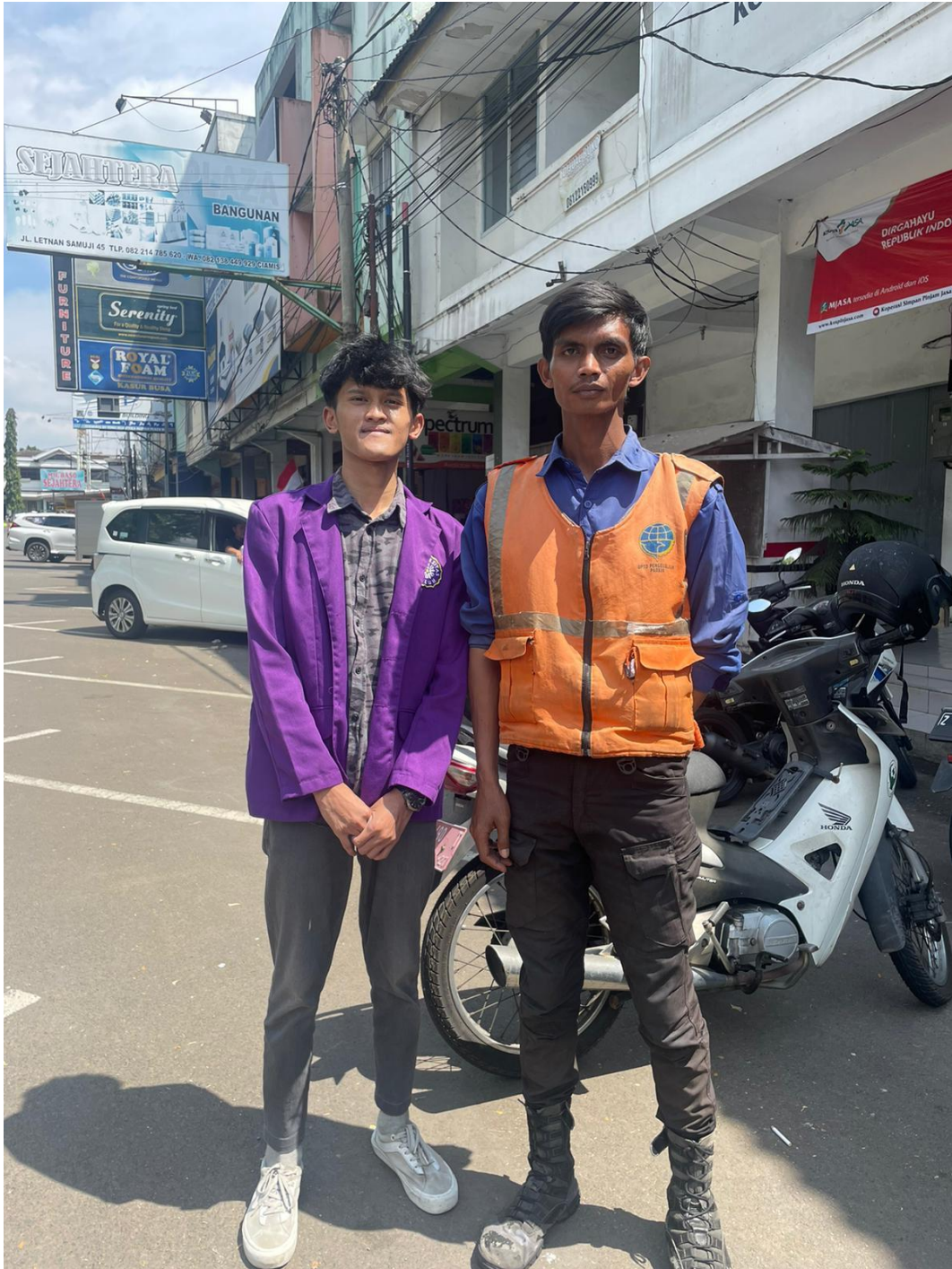
Gambar 7 Dokumentasi penelitian di lapangan petugas parkir