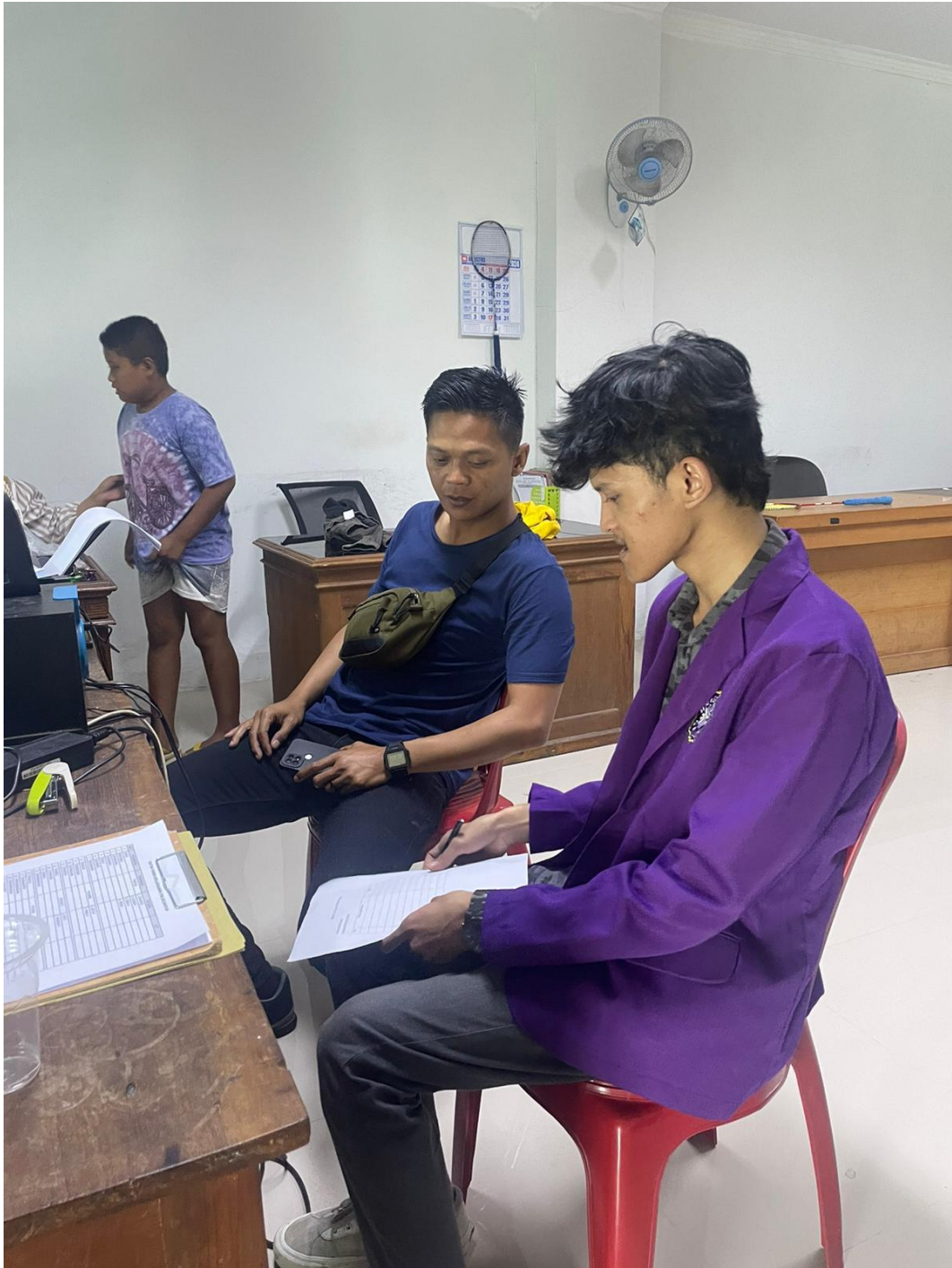
Gambar 5 Dokumentasi penelitian di Dinas Perhubungan Kabupaten Ciamis UPTD pengelolaan parkir