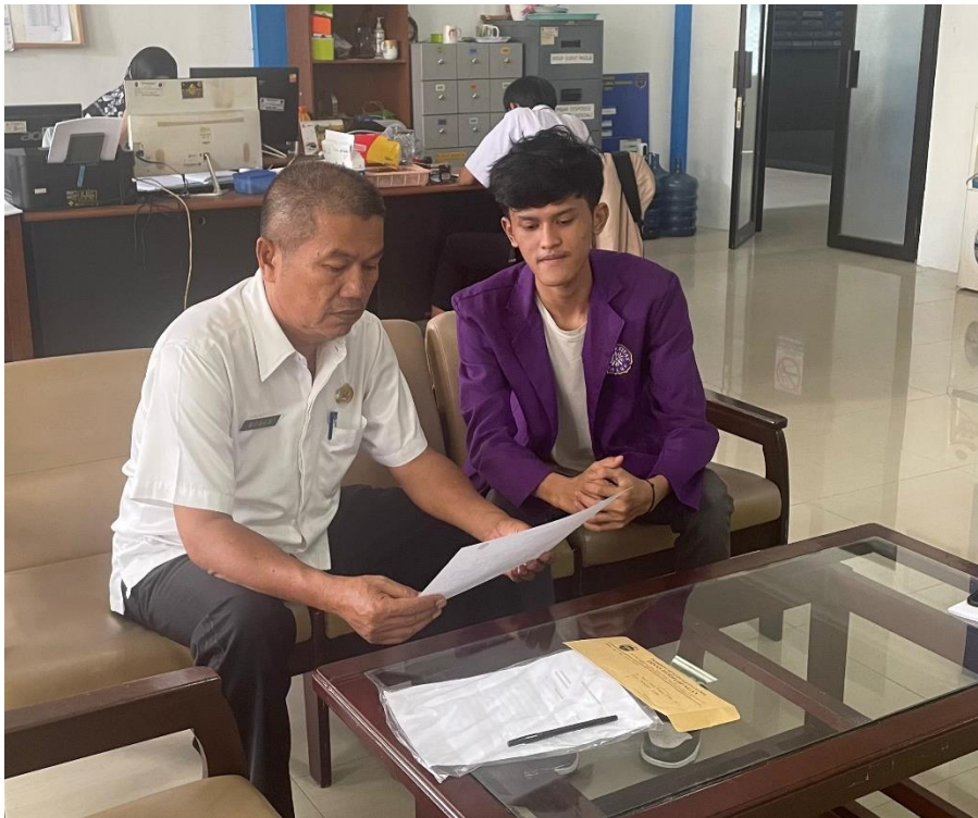
Gambar 1 Dokumentasi dengan Kepala Bidang Lalulintas di Kantor Dinas Perhubungan Kabupaten Ciamis