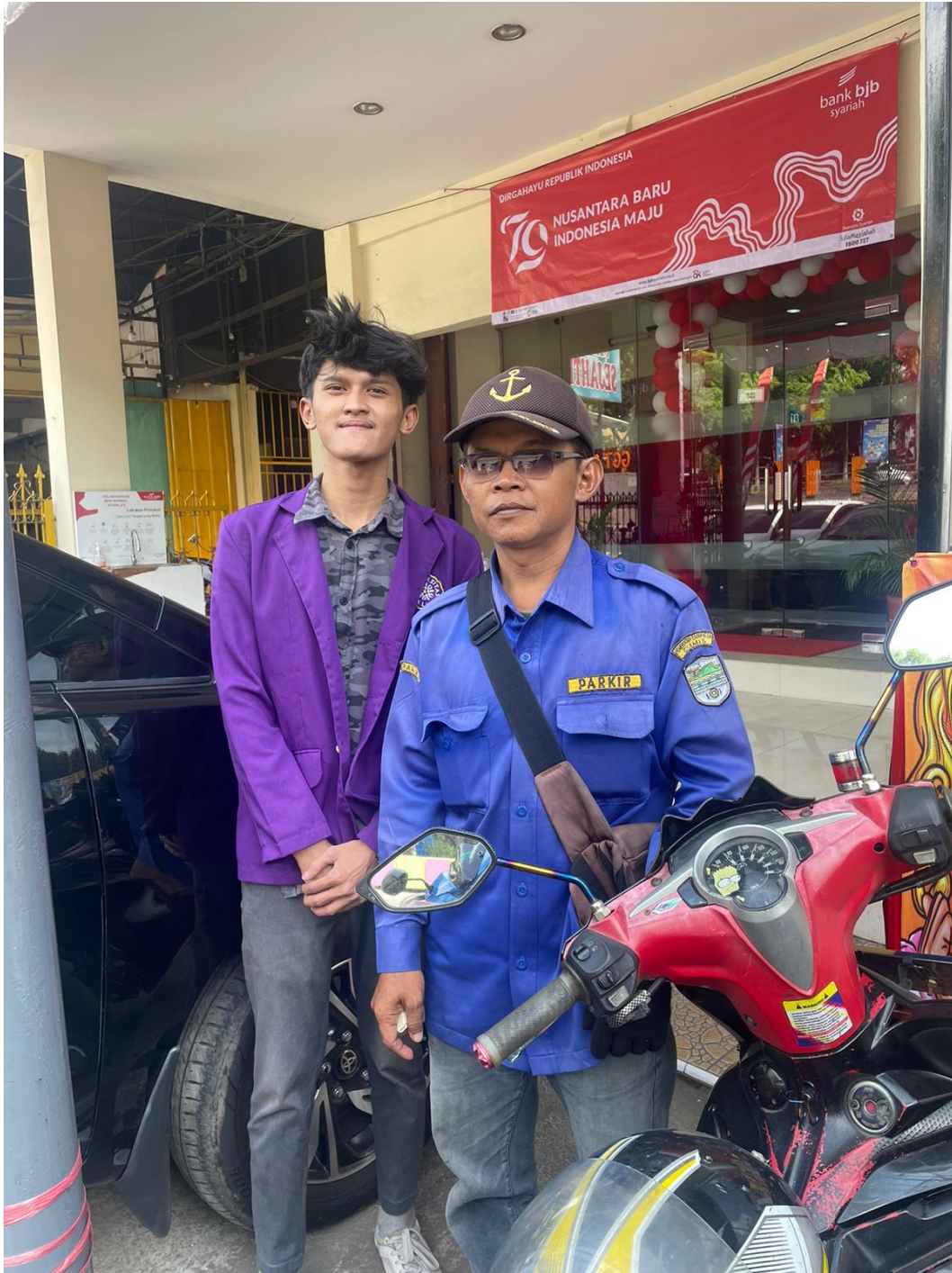
Gambar 6 Dokumentasi penelitian di lapangan petugas parkir