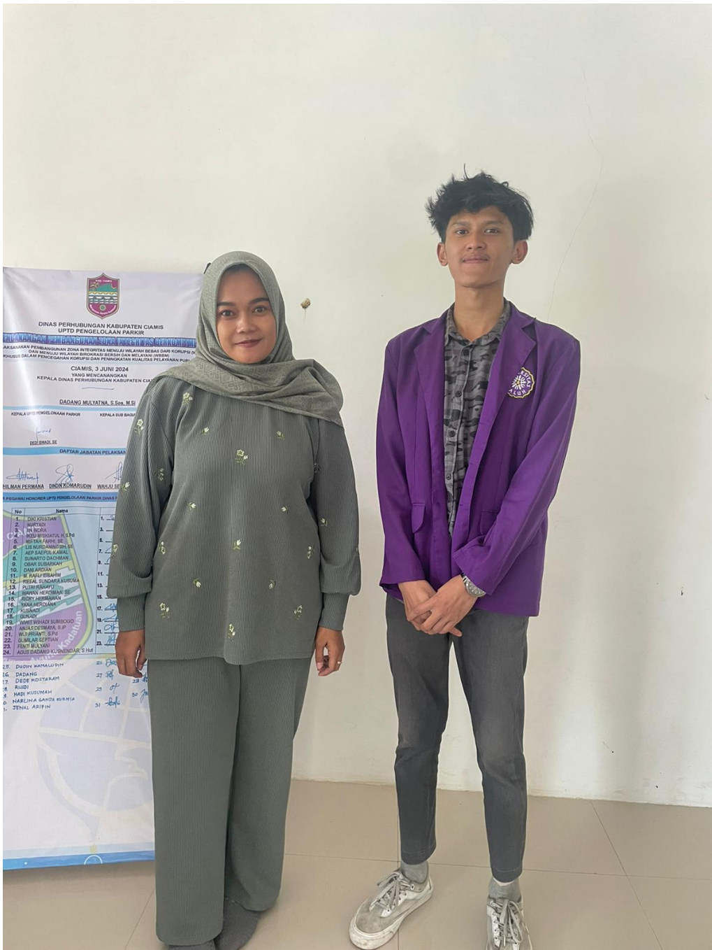
Gambar 4 Dokumentasi penelitian di Dinas Perhubungan Kabupaten Ciamis UPTD pengelolaan parkir