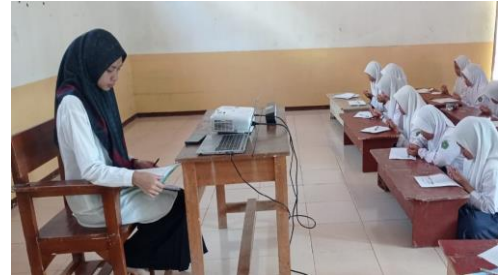
Picture 2. The teacher started the lesson by saying "Basmallah" together.