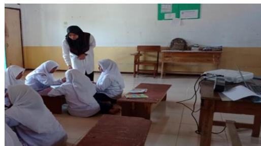
Picture 6. The teacher asks students to form groups and asks them to work in groups by answer the questions