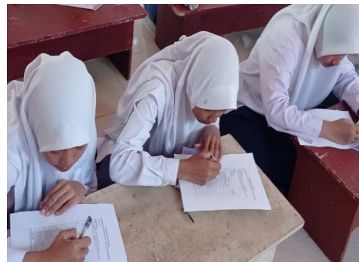
Picture 12. Students activities to fill out the questionnaire