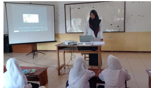
Picture 4. The teacher explains about the learning material by showing YouTube video