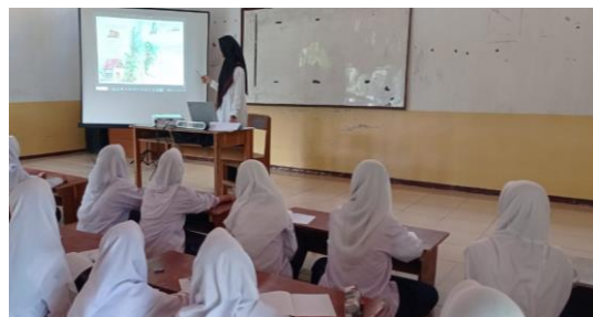
Picture 5. the teacher explained the material to be studied in digital picture book and asked students to read together