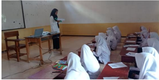
Picture 1. The teacher opened the lesson by greeting and filling the students' attendance