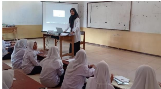
Picture 3. The teacher introduces and reviews digital picture book