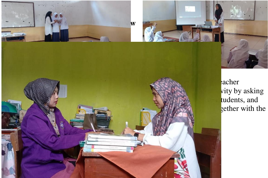
Picture 11. The interview activities with the English teacher