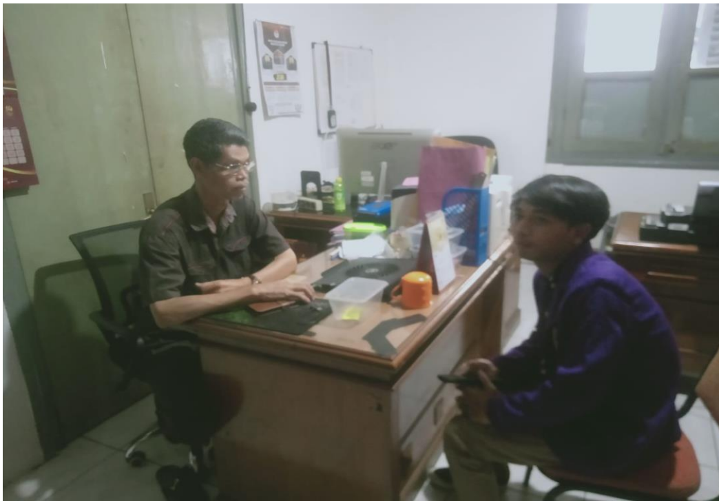
Wawancara dengan Divisi Perencanaan Data dan Informasi KPU Kabupaten Ciamis