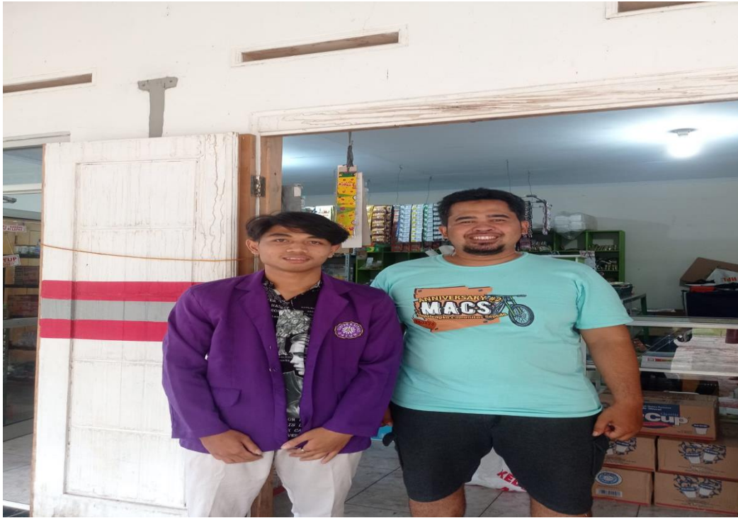
Wawancara dengan Ketua KPPS Lingkungan Sirnarasa TPS 006 Kelurahan Sindangrasa Kabupaten Ciamis