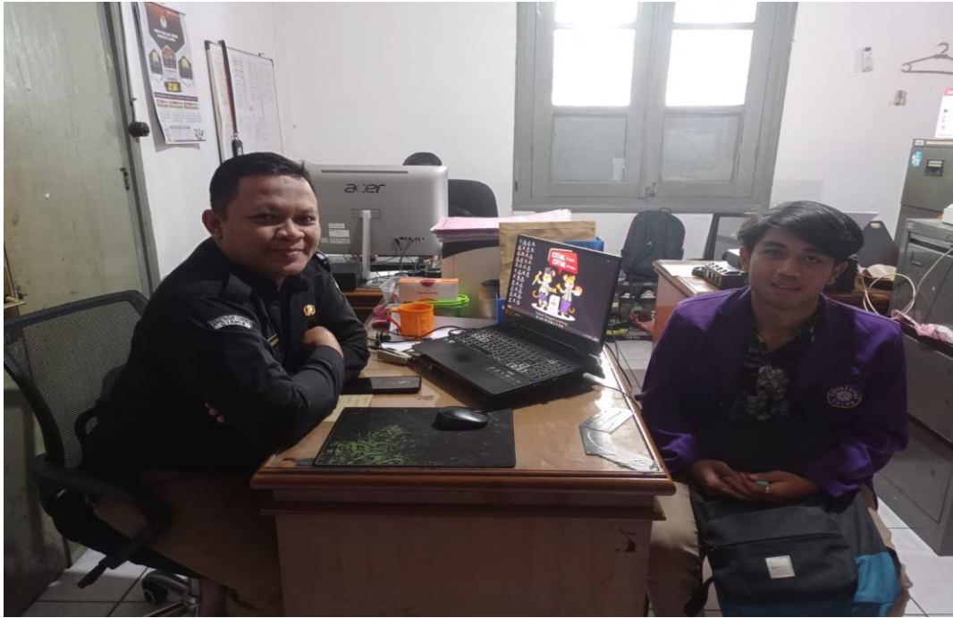
Wawancara dengan Divisi Program Data dan Informasi KPU Kabupaten Ciamis