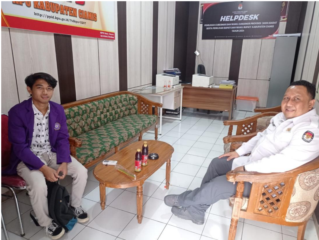
Wawancara dengan Sekertaris KPU Kabupaten Ciamis