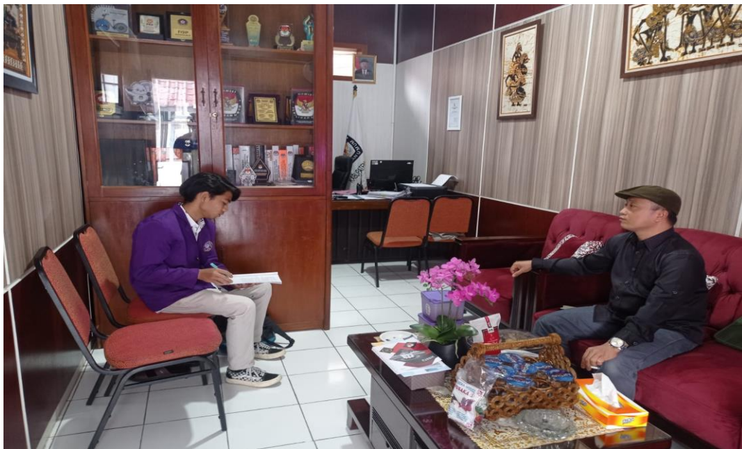
Wawancara dengan Ketua Divisi Perencanaan Data dan Informasi KPU Kabupaten Ciamis