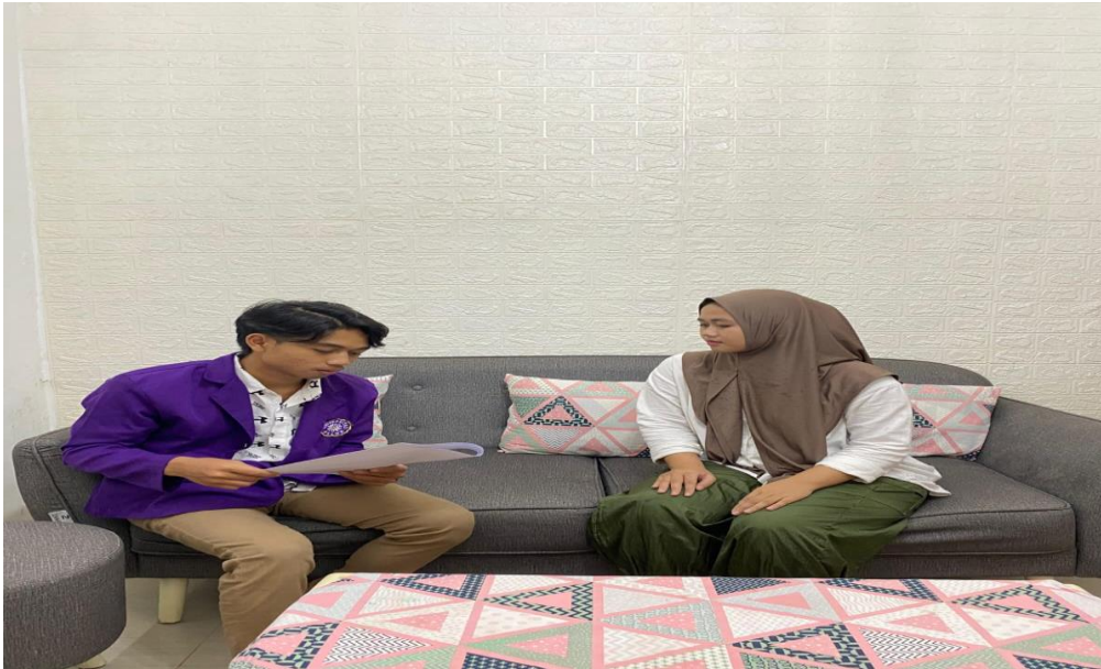
Wawancara dengan Petugas Pantarlih Lingkungan Sinarasa TPS 006 Kelurahan Sindangrasa Kabupaten Ciamis