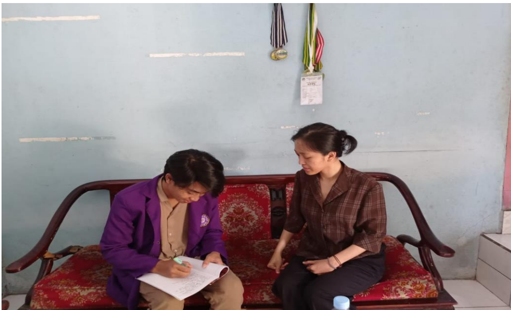
Wawancara dengan Ketua KPPS Dusun Desa TPS 003 Desa Handapherang Kabupaten Ciamis