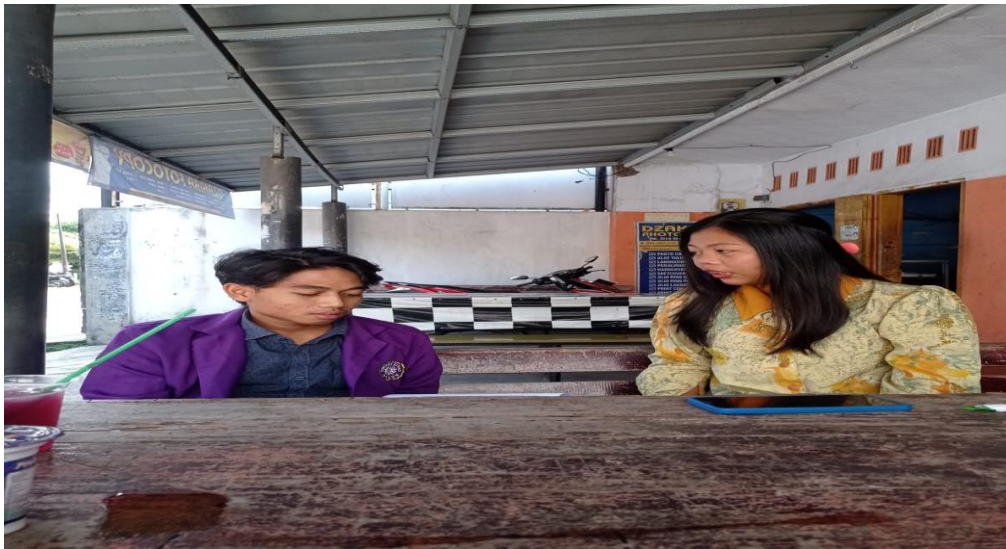
Wawancara dengan Petugas Pantarlih Dusun Desa Desa Handapherang Kabupaten Ciamis