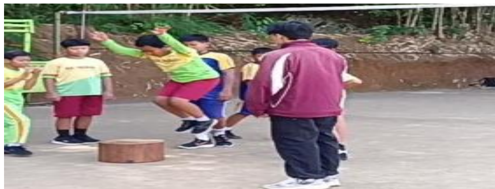
Latihan Box Jump