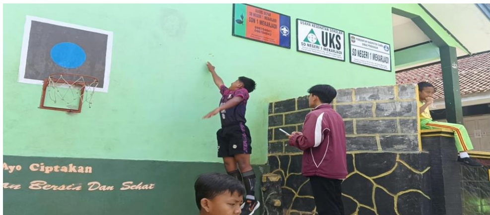
Tes setelah pemberian latihan ( Posttest ) Vertical Jump