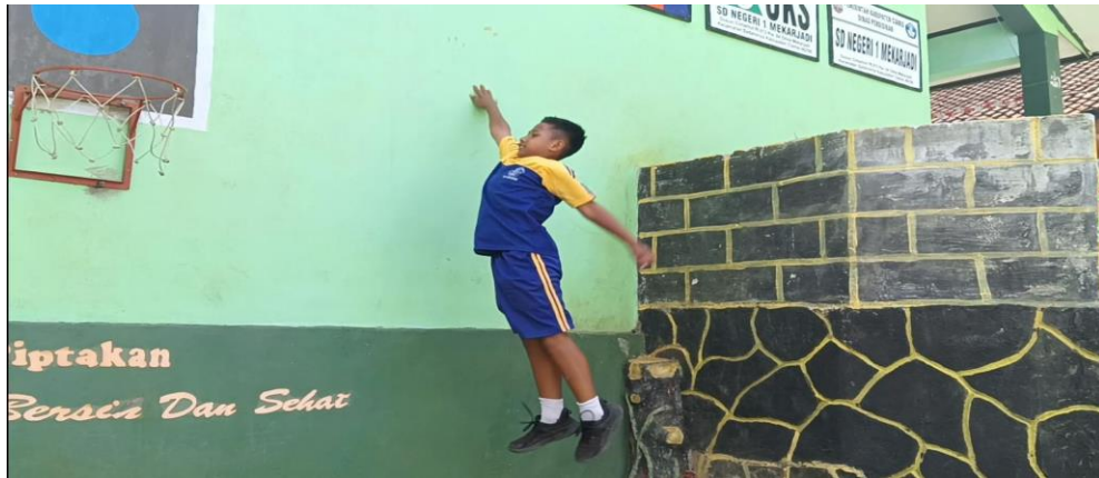
Tes sebelum pemberian latihan ( Pretest ) Vertical Jump