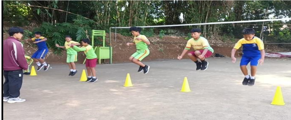
Latihan Standing Jump