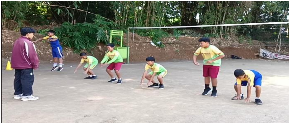
Latihan Frog Jump