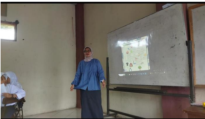
Picture 3 The Use of Crossword Puzzle in Teaching Vocabulary