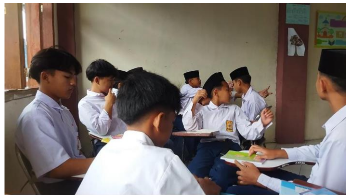
Picture 4 Students Group Exercise Crossword Puzzle Game