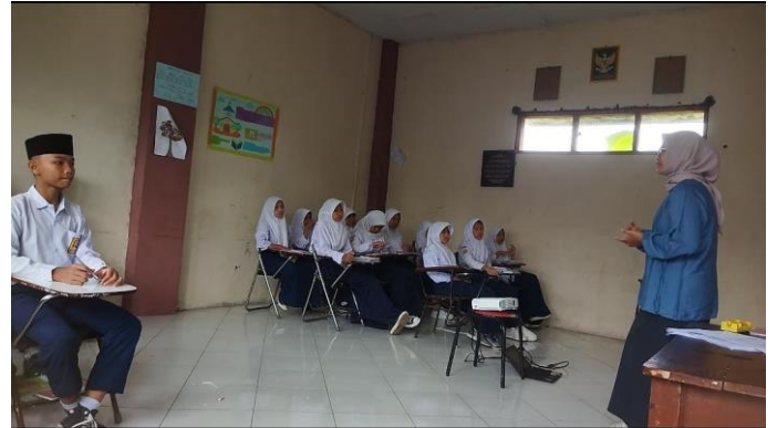
Picture 2 Teacher Explain The Material In The Second