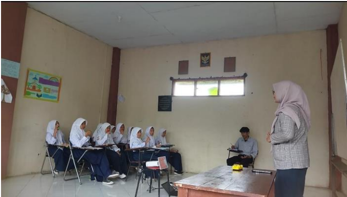
Picture 1 Teacher Explain The Material in The First Meeting