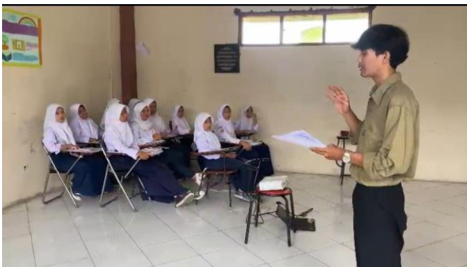
Picture 5 Filling Out Questionnaire for Student