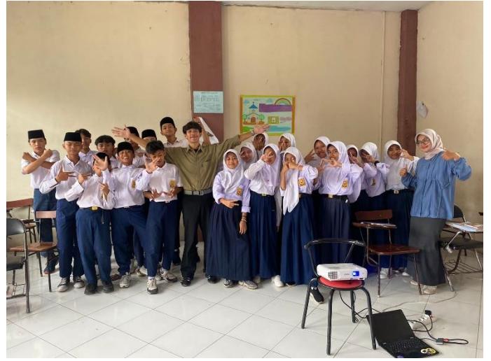
Picture 6 Observer an Participants