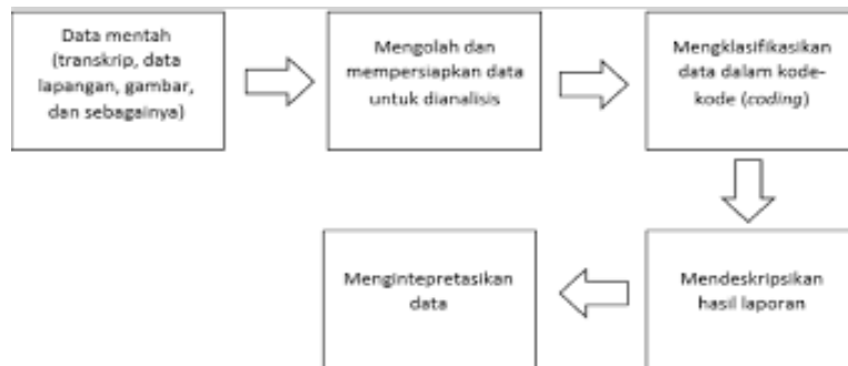
Gambar 3.2 Desain Penelitian Studi Kasus

Berikut desain penelitian kualitatif studi kasus dapat digambarkan sebagai berikut: