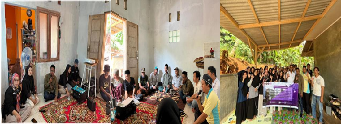
Gambar 2 Kegiatan Penyuluhan

membantu mengoperasikan media sosial sebagai sarana penjualan hasil produksi dari kelompok tani minasari