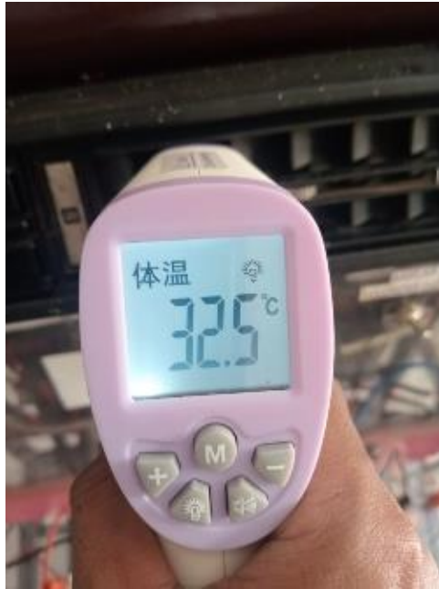
Pengujian Ke 1