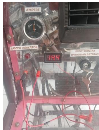
Besaran Voltase Beterai dengan Proses Pengisian