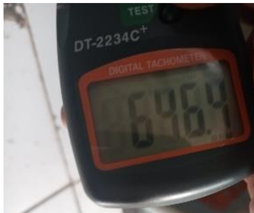
Pengujian Ke 2