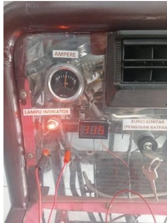
Besaran Voltase Baterai Sebelum Adanya Proses Pengisian