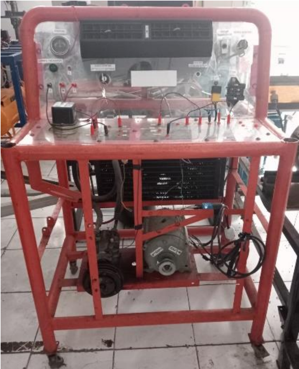
Lampiran 1. Simulator AC Sebelum Perbaikan