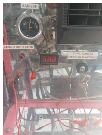
Besaran Voltase Baterai dengan Proses Pengisian dan AC dalam Kondisi Hidup