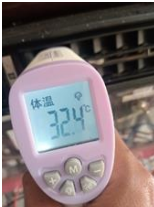
Pengujian Ke 2