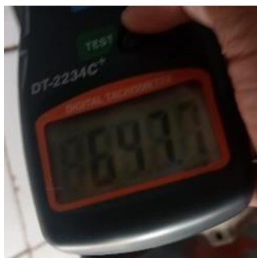
Pengujian Ke 3