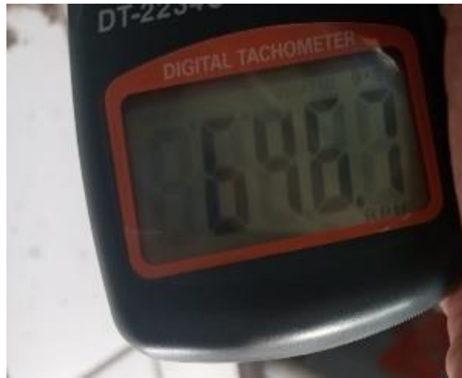
Pengujian Ke 1