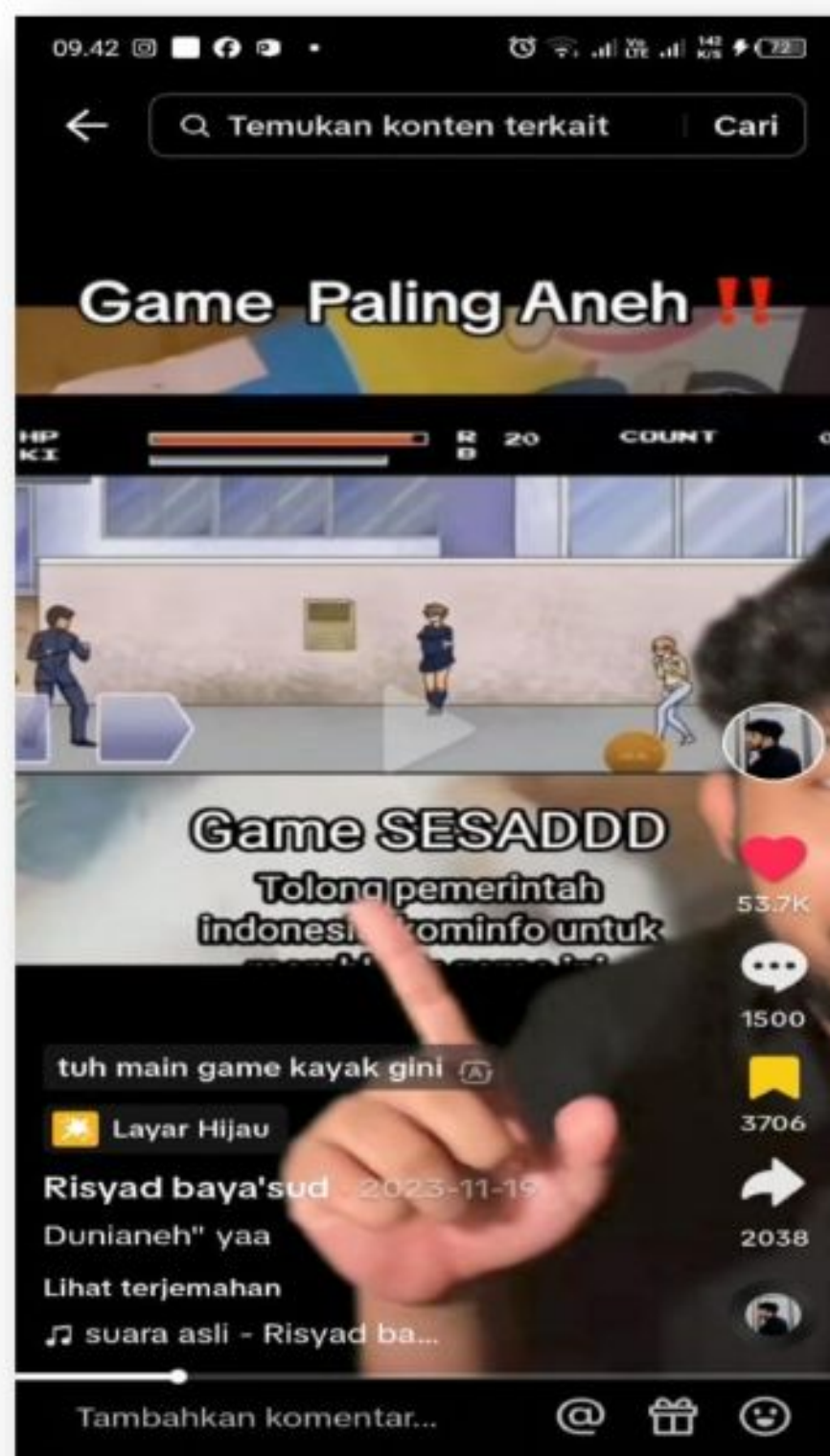
Gambar 4. Game Paling Aneh!!! 19 November 2023