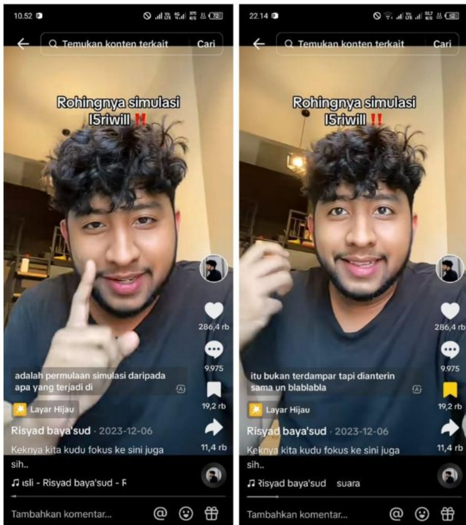
Gambar 8. Rohingnya Simulsasi Isriwil!! 06 Desember 2023