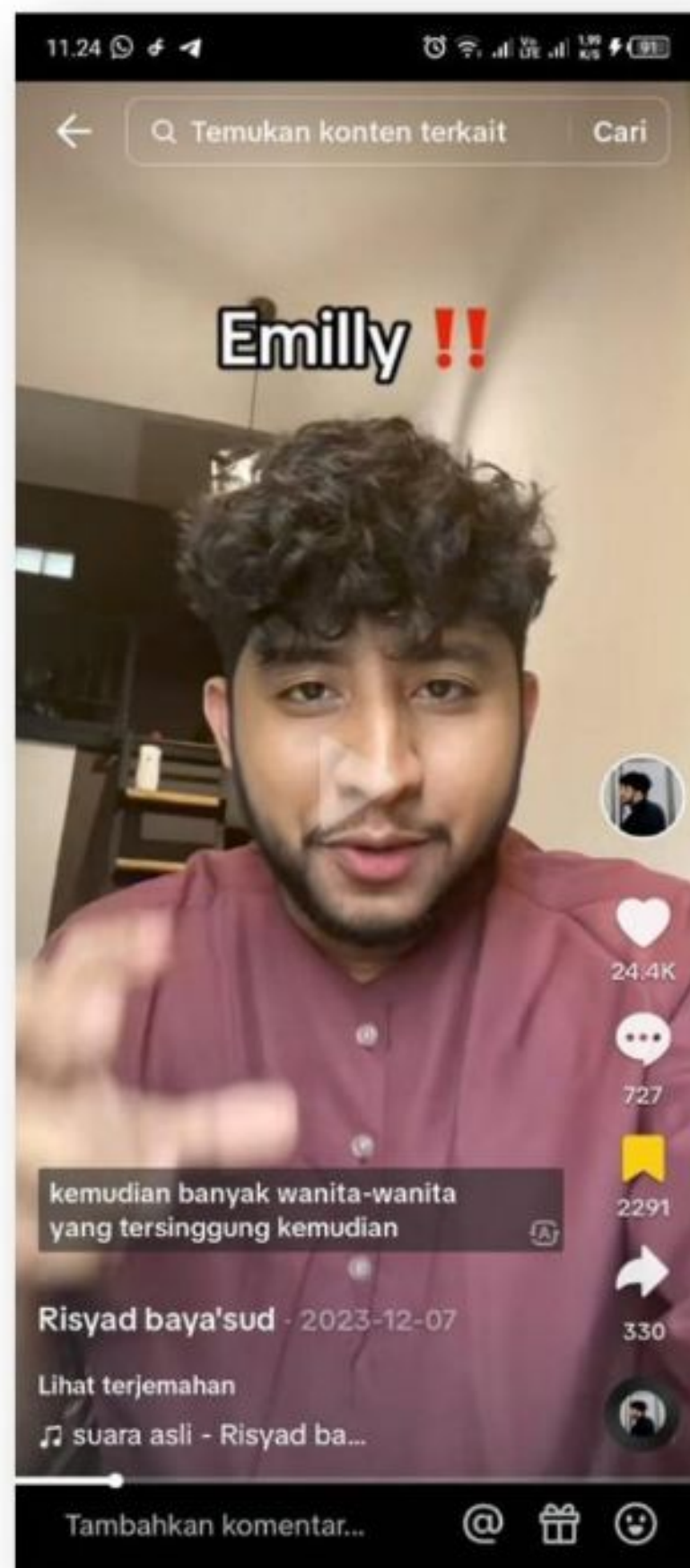
Gambar 6. Emilyy!!! 07 Desember 2023