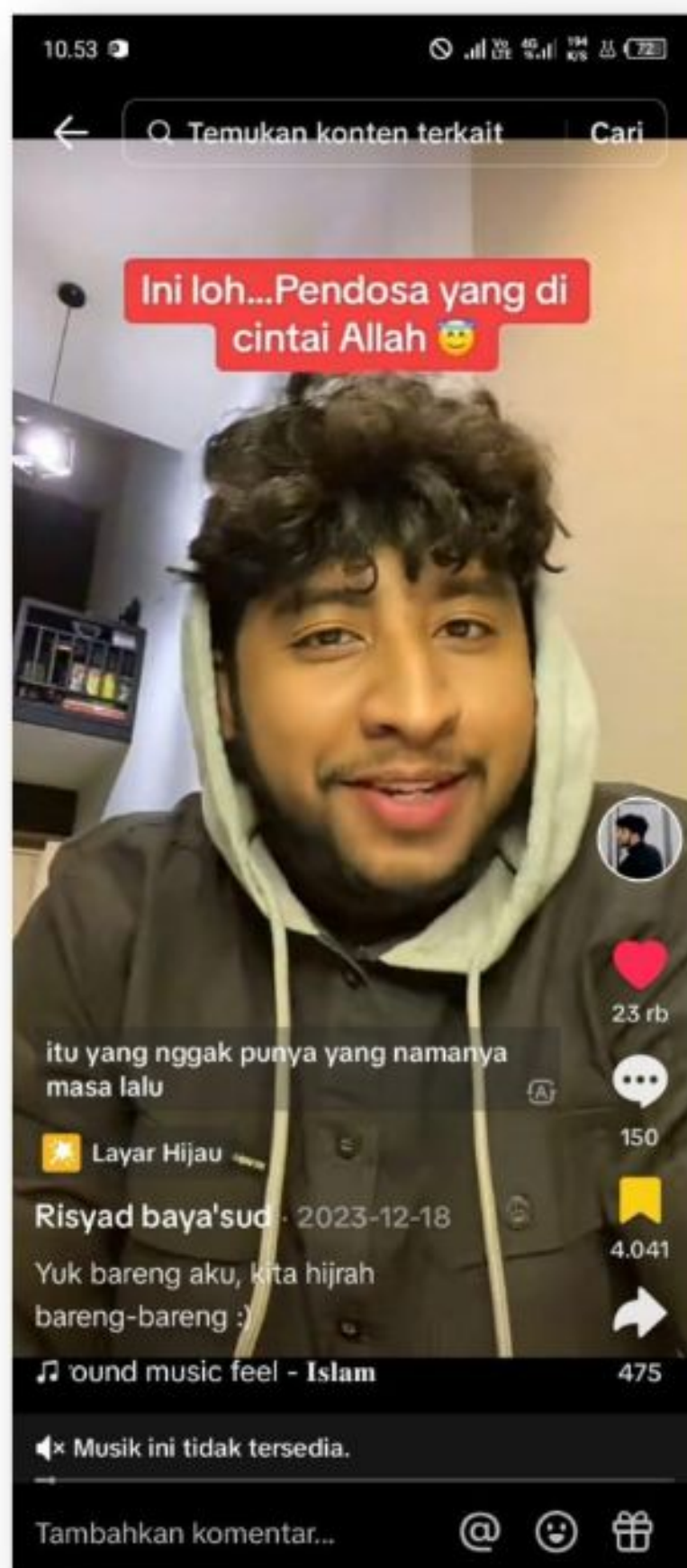
Gambar 7. Ini Loh.. Pendosa Yang Dicintai Allah 16 Desember 2023