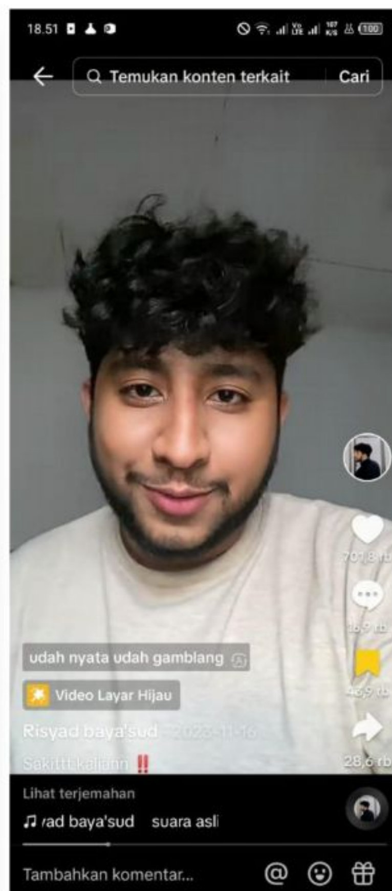
Gambar 3. Pengikut Satanisnya Hindia Nih 16 November 2023.