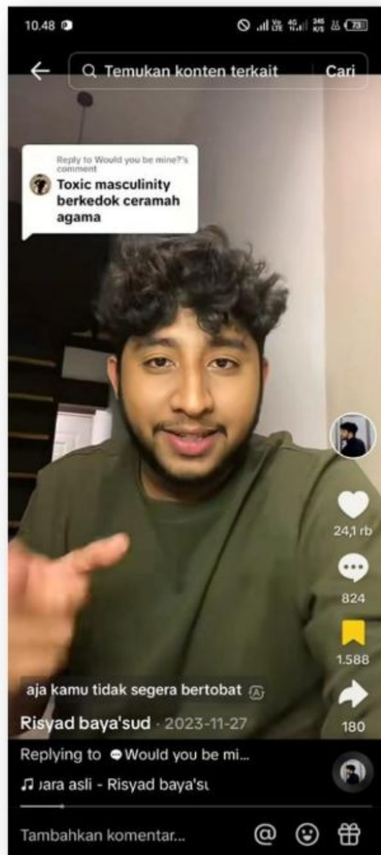
Gambar 5. Toxic Masculinity Berkedok Ceramah Agama 27 November 2023