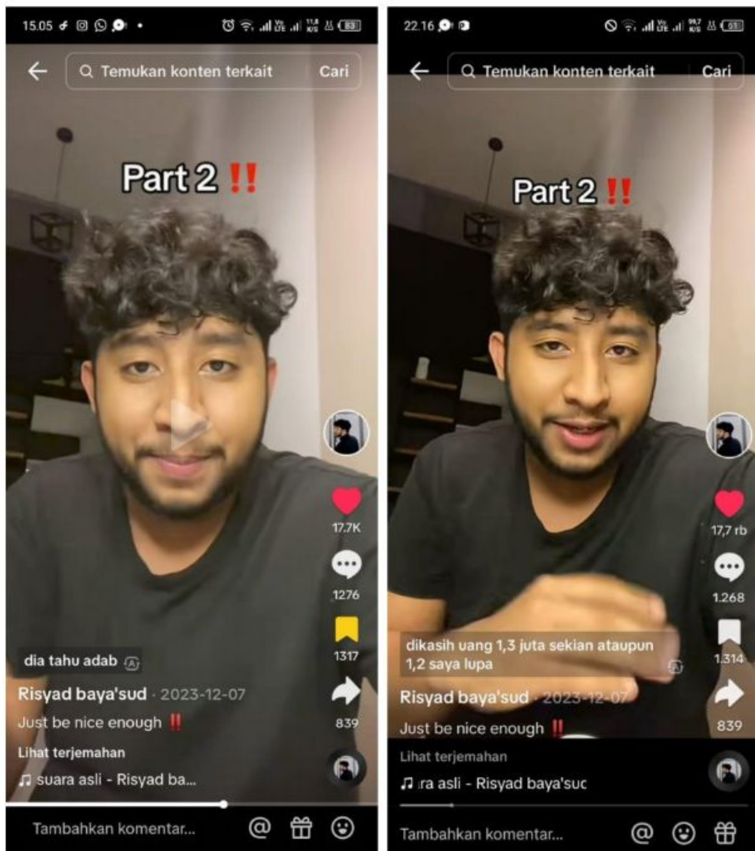
Gambar 9. Rohingnya Simulsasi Isriwil!! Part 2 07 Desember 2023