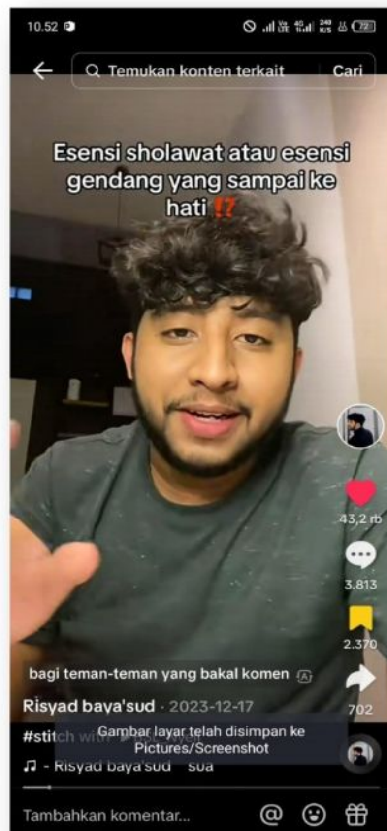
Gambar 10. Esensi Sholawat Atau Esensi Gendang Yang Sampai Hati? 17