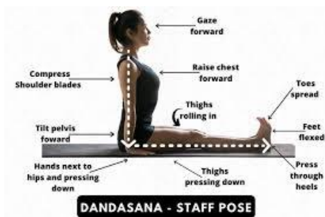
Gambar II.6 Pose Dandasana

Dalam pose ini, tahapan yang harus dilakukan adalah sebagai berikut: