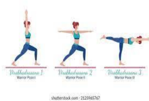
Gambar Pose Virabhadrasana I

Dalam pose ini, tahapan yang harus dilakukan adalah sebagai berikut: