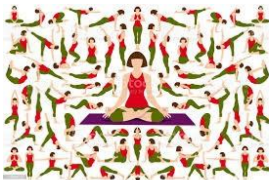
Gambar Pose Asana

Asana adalah sikap duduk pada waktu melaksanakan yoga. Dalam buku yoga sutra oleh Anand Krishna (2015) menyebutkan tidak mengharuskan sikap duduk tertentu, tetapi menyerahkan sepenuhnya pada sikap duduk yang paling disenangi dan rileks, asalkan dapat menguatkan konsentrasi dan pikiran dan tidak terganggu karena badan merasakan sakit akibat duduk yang dipaksakan. Selain itu sikap duduk yang