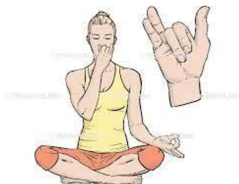
Gambar Pose Pranayama

Pranayama adalah pengaturan nafas keluar masuknya paru-paru melalui lubang hidung dengan tujuan menyebarkan prana (energi) keseluruh tubuh. Pranayana terdiri dari Puraka yaitu memasukkan nafas, Kumbhaka yaitu menahan nafas, dan Recaka yaitu mengeluarkan nafas. Puraka, Kumbhaka, dan Recaka dilaksanakan pelan-pelan bertahap masing-masing selama dalam waktu tujuh detik (Krishna, 2015).