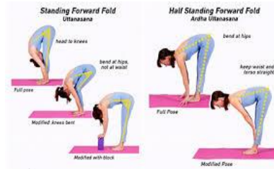
Gambar Pose Uttanasana

Langkah-langkah melakukan yoga Uttanasana: