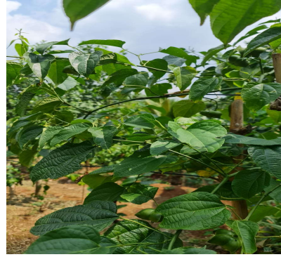
Gambar 2. Tananam Sacha Inchi yang berpotensi untuk dikembangkan secara ekonomi