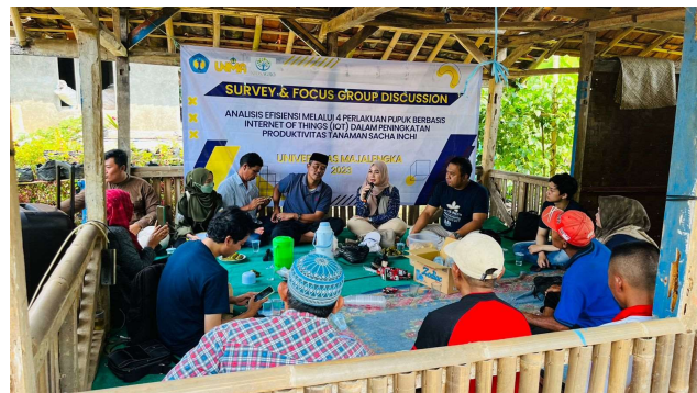
Gambar 3. Pelaksanaan Kegiatan PKM

Kegiatan dilaksanakan di Desa Sindangkerta dengan para peserta anggota kelompok wanita tani srikandi dan aparat desa serta ketua Rt, juga penyuluh pendamping pelaksanaan kegiatan diwilayah setempat. Keterlibatan kegiatan ini dimulai dari Universitas Majalengka dan Universitas Galuh, baik dosen maupun mahasiswa, dan praktisi sekaligus sebagai off taker juga pengusaha industri bahan baku sachu inchi sebagai mitra perguruan tinggi maupun petani. Metode yang digunakan dengan pendekatan brain storming , ceramah, serta diskusi tanya jawab (Direktorat Riset Pengabdian Kepada Masyarakat, 2020).