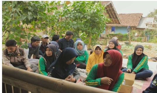
Gambar 4. Para Pseserta Kegiatan PKM